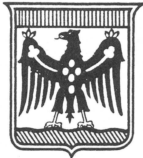
Fig. 3. Wappen der Provinz Trient 1927.

Ein entsprechender Vorschlag wurde im Juli 1982 auf Anregung des Präsidenten Pancheri vom Regionalausschuss gutgeheissen. Das neue Wappen ist geviertet: 1 + 4: In Silber über grünem Vierberg ein schwarzer goldenbewehrter Adler, mit roten Flammen auf seiner Brust und mit goldenen Flügelspangen (Trient), 2 + 3: in Silber ein roter, goldenbewehrter Adler mit goldenen Flügelspangen (Tirol)