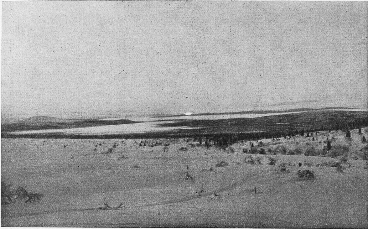
Winter Sonnenwende im Finnisch-Lapland.