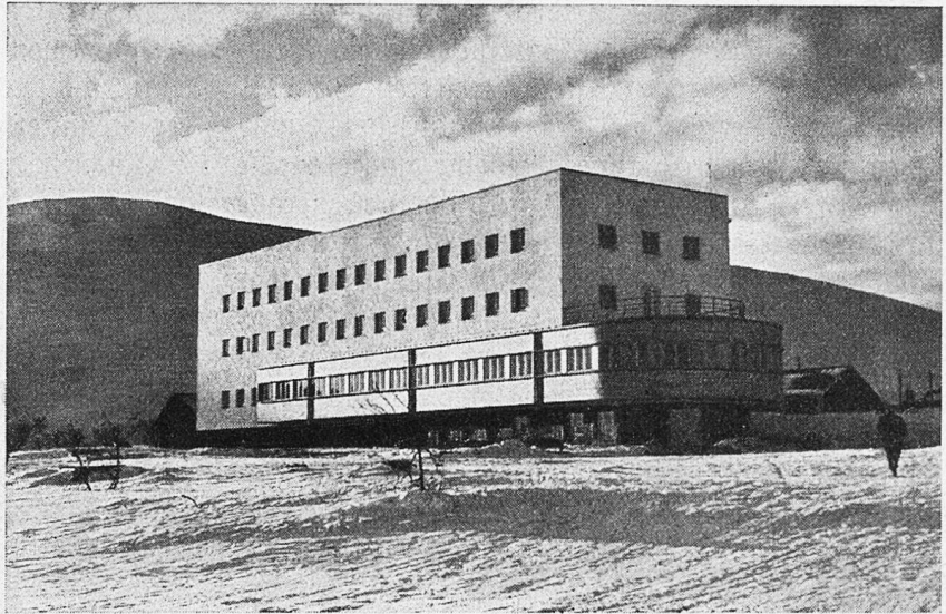
Finnlands erstes Gebirgs-Touristenhotel auf dem Pallastunturi.

Legt man sich dann schließlich doch zum Schla-