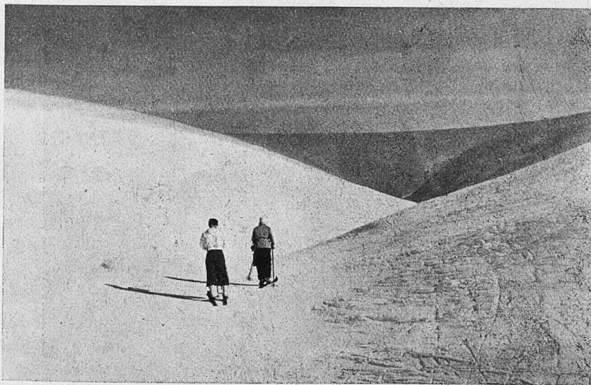
Auf den Bergfluppen des Pallastunturi.

weit fortgeschritten, daß man den Sirius nicht mehr sieht. Aber heller als Dämmerung wird es hier nicht um diese Zeit. Über dem Schnee liegt ein blauer Hauch ausgebreitet. In der kristallklaren trockenen Luft erheben sich die verschiedenen massiven Berggipfel des Pallastunturi (der höchste ist 821 m hoch) in scharfer, plastischer Weise, und die ganze ungeheure Größe und Weitflächigkeit der Landschaft erleben wir vor unseren Augen. Und eine Einsamkeit und Stille ohnegleichen, voll unendlicher, wohlthuender Schönheit, breitet sich vor uns aus.