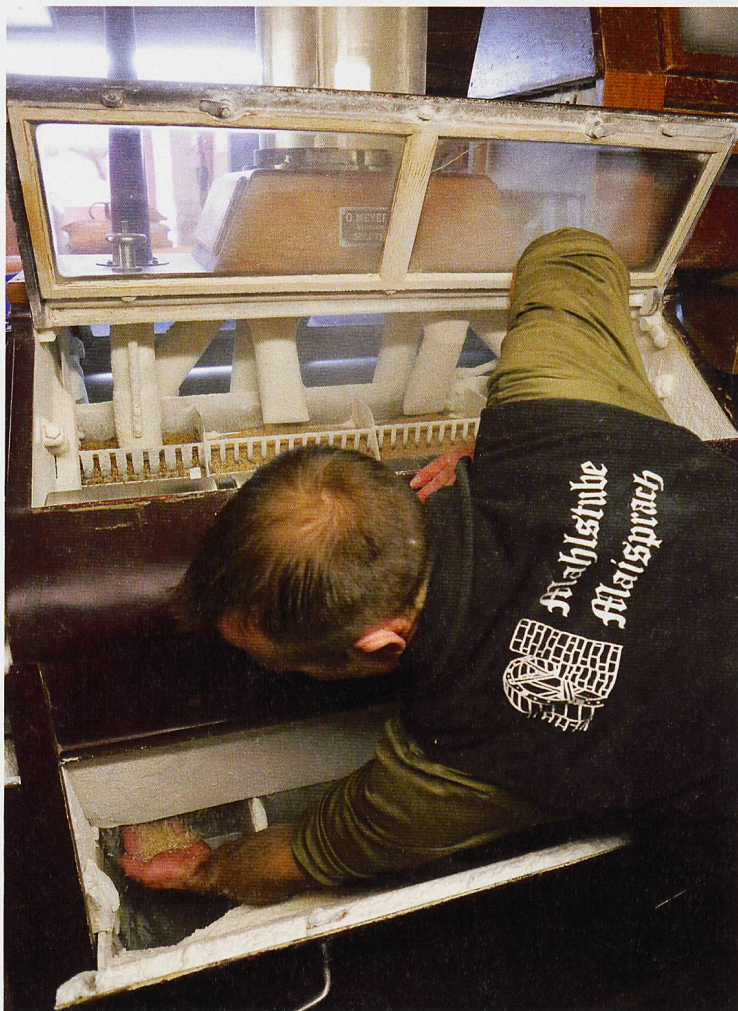
Das Interesse an lokalem Mehl ist gross: Die Mühle in Maisprach läuft an sechs Tagen pro Woche.

region vertrieben. Auch zahlreiche Bäckereien wie zum Beispiel «Süesses und Guets» in Frenkendorf, die Bäckerei «Grellinger» in Reinach, die Backstube der «ge.m.a» auf dem Basler Dreispitz oder die Bäckerei «Kult» in der Basler Innenstadt backen mit Mehl aus Maisprach. Bäckereien, von denen sich wiederum zahlreiche Gastrobetriebe beliefern lassen. Um herauszufinden, ob das Mehl vom Gipfeli, in das man gerade beisst, auf den sonnigen Hügeln des Oberbaselbiets gewachsen ist, und ob das Getreide in der 78 Jahre alten Mühle