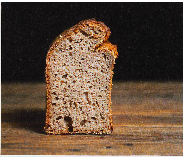
Brot – ein hochwertiges Produkt