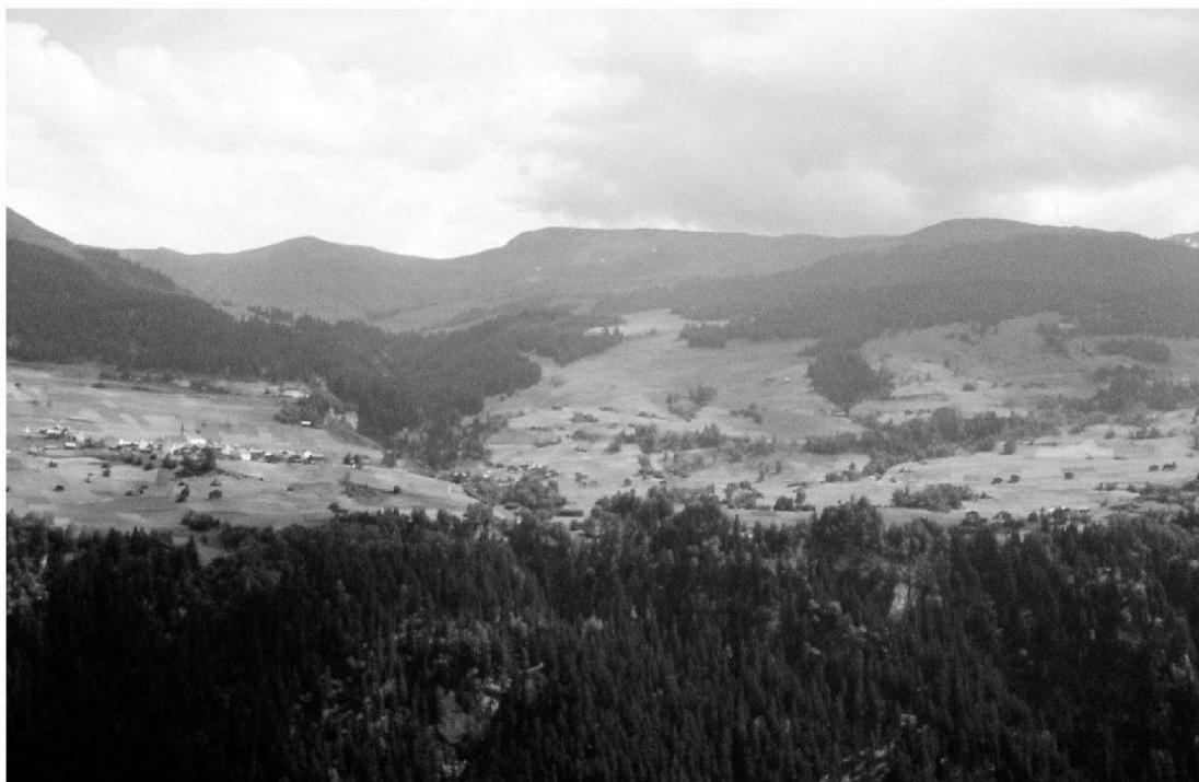
Sursaissa, Sursaissa tudestga u Obersaxen

magari si Sursaissa (Radioscola 1962, 13, 6); in Sursaissa sun situats ils seguaints chastels (BAZZELL/GAUDENZ 1976, 190); ils oters confederats da la Lia Sura ... sco ... quels da Sursaissa (BAZZELL/GAUDENZ 1976, 198); Christoffel, chavaller da Sursaissa (PEER 1982, 39); la glied da Sursaissa ha apprezzau ses ... priedis (Gas. Rom. 1995, 87, 10.5); Gion Gieri da Sursaissa , cumpra en Surselva gnanc ina aissa (LQ. 1997, 63, 6.4); eassan rivos a Meierhof sen la Sursaissa (LQ. 1997, 202, 13.2).