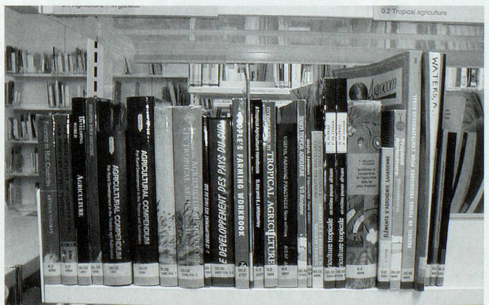
Blick in die Basisdokumentation von InfoAgrar.