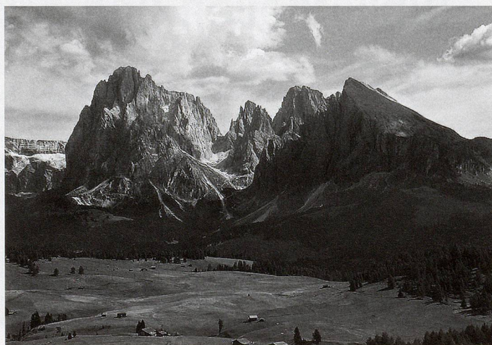
La montagne: de l'image au concept. Le Sassolungo, massif des Dolomites, Italie.

De nombreux historiens ont montré que la catégorie du «montagnard» devait bien peu à ses représentants mais beaucoup au discours philosophique et naturaliste du XVIII e siècle. Cette identité, naturalisée, connaît une forte diffusion dans les sociétés modernes à la faveur du développement de la littérature populaire et touristique, et des travaux de vulgarisation, notamment pour les publics scolaires. Le «montagnard», tout comme d'ailleurs les «ouvriers», la «bourgeoisie» ou les «paysans», a donc