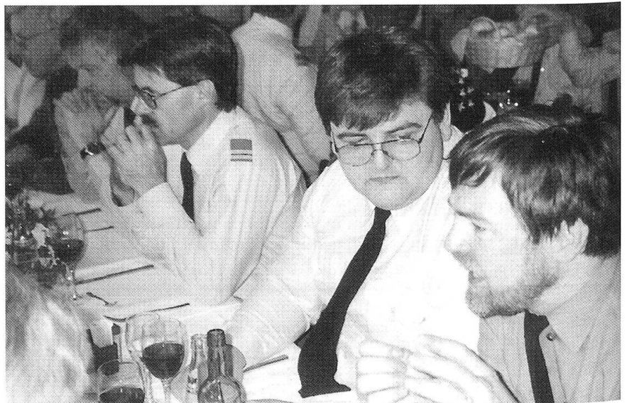
Einige der Teilnehmer der Sektion Aargau anlässlich der Delegiertenversammlung des Schweizerischen Fourierverbandes (SFV) in Winterthur.

Beim anschliessenden gemütlichen Beisammensein wurden bestehende Beziehungen gepflegt und neue Kontakte geknüpft.