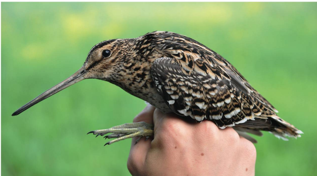
Fig. 2 : Bécassine double photographiée en main après sa capture au filet, Bolle di Magadino, Locarno TI, avril 2011.

rectrices externes blanches étalées formant peu après le décollage un triangle blanc bien visible de chaque côté de la queue. Un autre critère noté est le rapport entre la longueur du bec et de la tête, plus petit chez la Bécassine double, qui a un bec plus court et une tête plus trapue que la Bécassine des