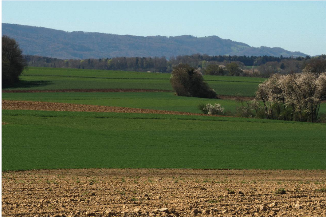
Fig. 4: Paysage et habitat (au premier plan) dans lequel l'Oedicnème criard a fait escale, Bonfol JU, le 7 avril 2011.

Moncevi (577°1/258°0, 470 m), vers 11 h 55, un oiseau bien typé s'envole à mon passage et j'identifie alors sans peine un Oedicnème criard.