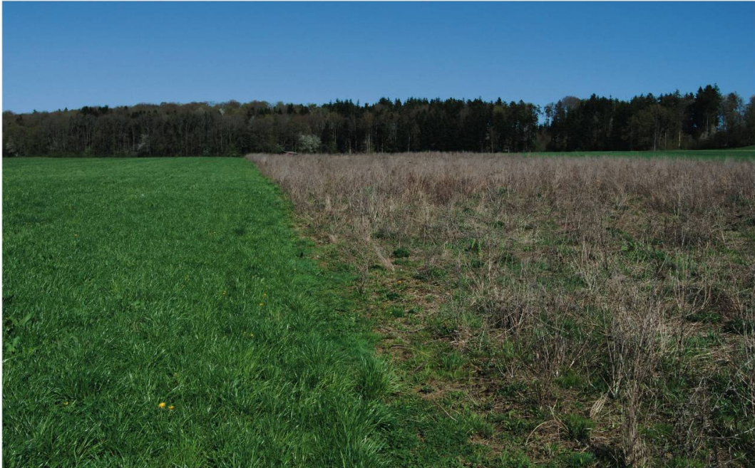
Fig. 1 : Jachère florale située au sud des étangs de Dampfreux JU, site d'escale de la Bécassine double, le 7 avril 2011.