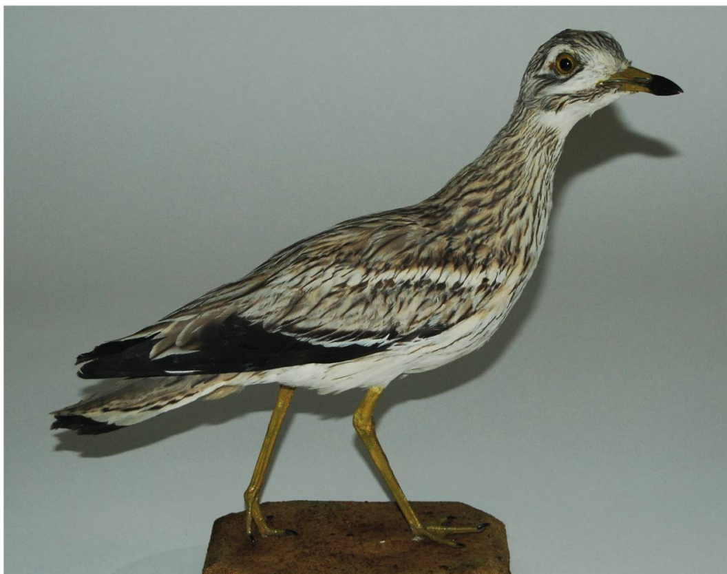
Fig. 5 : Préparation de l'Oedicnème criard tiré à La Chaux-des-Breuleux JU en 1955 par Raymond Boillat et déposé dans les collections du Musée d'histoire naturelle de La Chaux-de-Fonds, 18 septembre 2014.

Elle a été réalisée dans l'un des secteurs les plus favorables de la région au vu des vastes surfaces ouvertes d'un seul tenant. Notre observation s'inscrit à l'échelle suisse dans un contexte quelque peu inhabituel. Le passage printanier de l'espèce au cours de l'année 2011 s'est révélé en effet bien au-dessus de la moyenne (13).