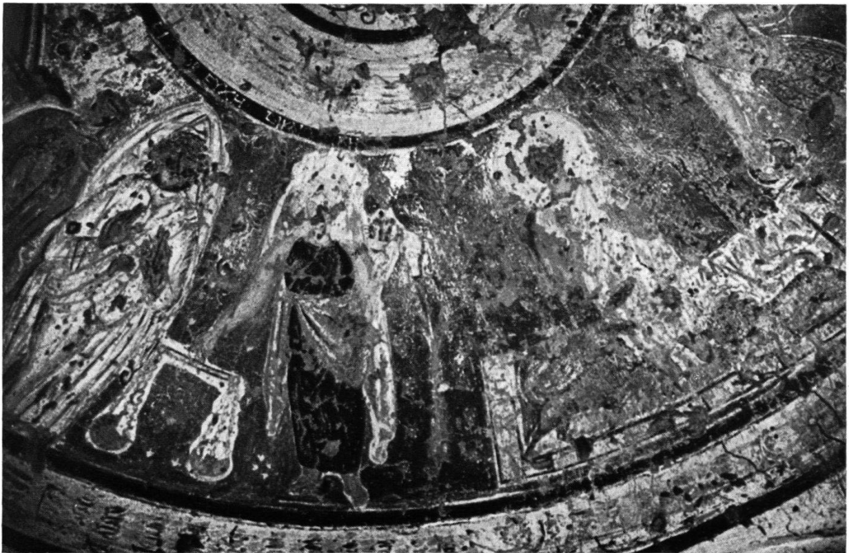
Abb. 2. Freske aus der «Friedenskapelle» der koptischen Nekropole von Bagawät bei der Oase Kharga