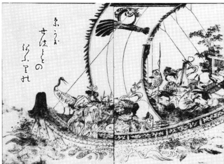
Abb. 1: Takarabune

wähntes Bild eines Schatzschiffes im Fluss treiben zu lassen. Auf diese Weise sollte der Traum unwirksam gemacht werden. 10