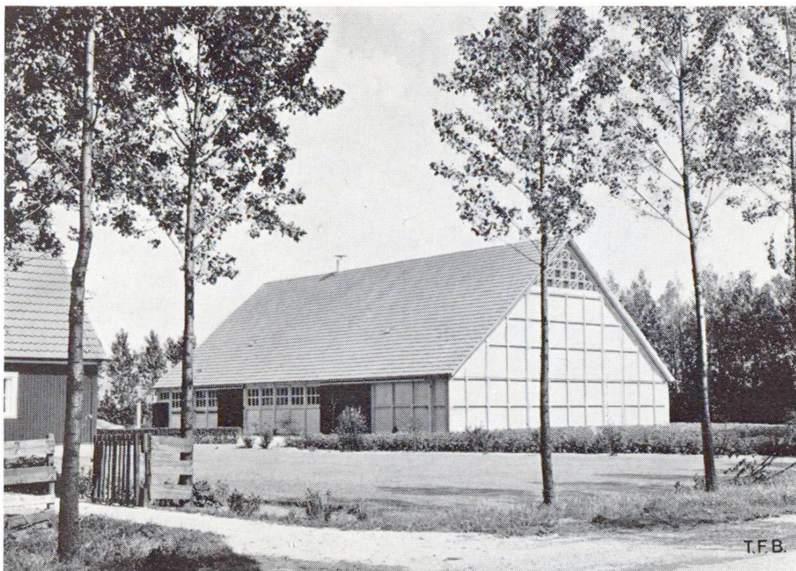
Fig. 5 C'est par milliers qu'on a déjà construit et qu'on construira encore de telles fermes dans les polders du Zuidersee

Le but principal est celui de la réalisation d'étables solides et bien isolées en éléments préfabriqués. Un élément de paroi risque d'être trop lourd. On peut imaginer alors qu'il soit formé de deux éléments identiques, l'un pour l'extérieur l'autre pour l'intérieur, formés chacun par une combinaison béton-terre cuite ou béton-plastique. La liaison transversale pourrait se réaliser au moyen de plaques minces en plastique renforcé de fils. Le problème se simplifie sensiblement si l'étable est un bâtiment séparé, sans surcharge des parois et plafonds.