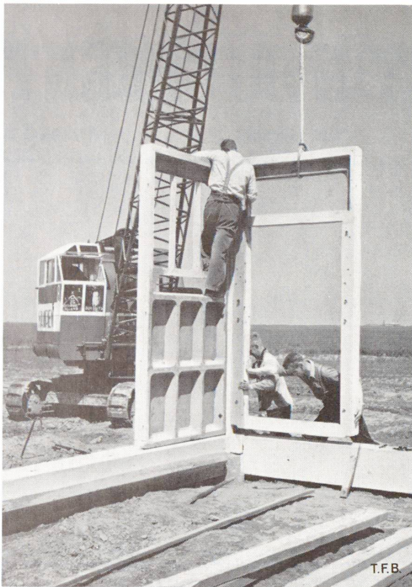
Fig. 1 Construction de bâtiments agricoles sur les terrains nouvellement conquis sur le Zuidersee (Hollande). Une petite grue facilement mobile est utilisée pour le montage des éléments de parois

de plus consiste à diminuer le nombre des domaines en agrandissant certains d'entre eux qui sont bien équipés, par l'adjonction de petites exploitations non rentables dans les conditions actuelles. Cette évolution se manifeste déjà et a bien des chances de s'accélérer. Des améliorations de ce genre augmentent fortement la rentabilité d'une exploitation agricole. Dans des fermes plus grandes, on peut pousser l'industrialisation de l'exploitation ce qui permet de réduire la main-d'œuvre si onéreuse.