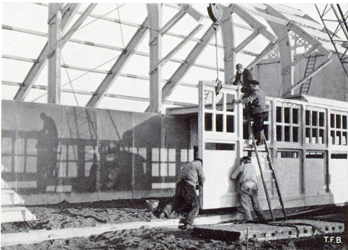
Fig. 2 Montage d'un bâtiment en éléments préfabriqués en béton et en bois

Ce bref exposé de la situation laisse entrevoir que la construction en éléments préfabriqués va jouer un rôle important dans les futures exploitations agricoles.