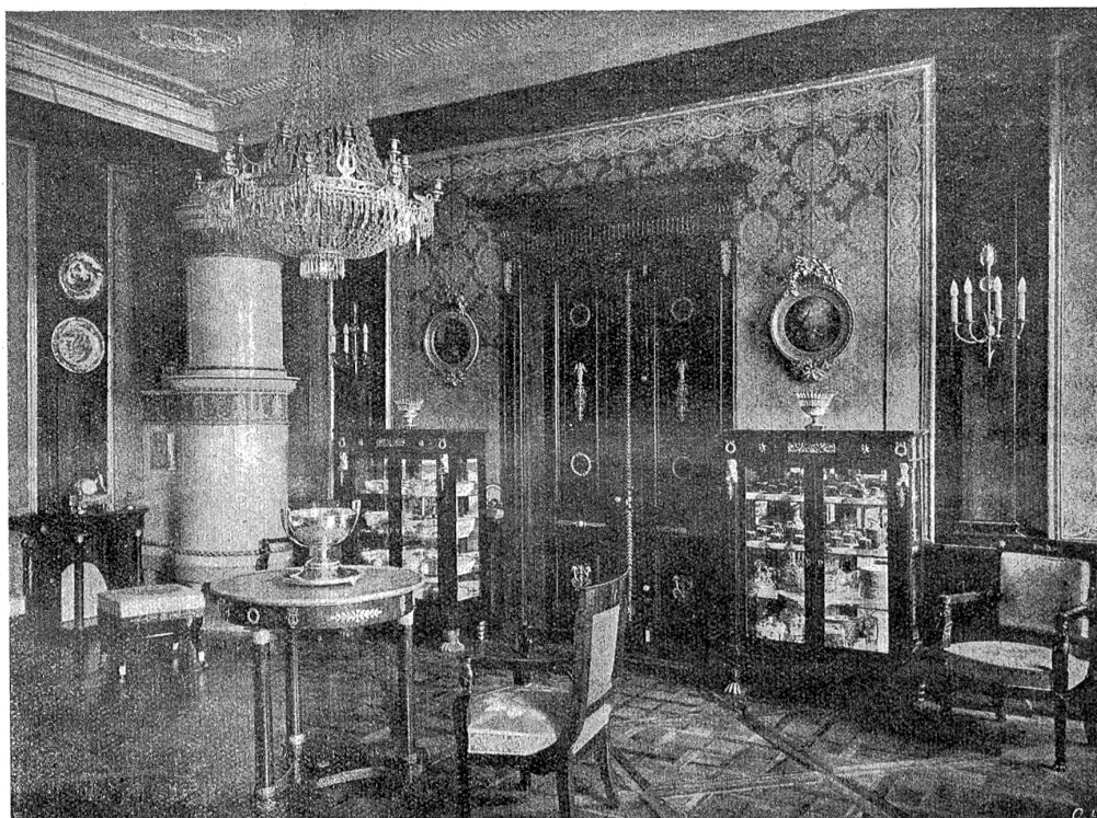
Kleiner Empire-Salon im I. Stock.