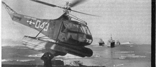
Links: Die Wal-Bay, seawärts, von einem Helicopter-Flugzeug aus gesehen. Die Einfahrt ist 380 Meter breit; sie hat sich seit der letzten Expedition im Jahre 1958 um rund 3 Kilometer verengt, und zwar durch das von beiden Seiten vorstossende Eis, das eine Dicke von 18 Metern aufweist.