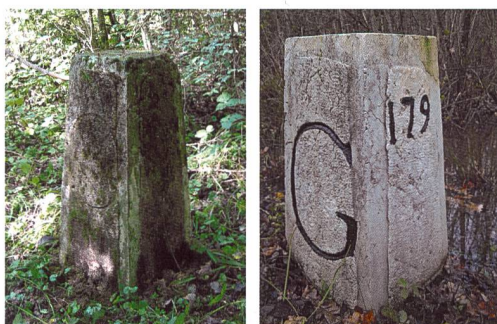
Figure 6: Borne 179

Ce financement donne donc droit à un certificat unique, une possibilité de mention de son parrainage sur un document public, mais à aucun droit sur l'objet à quelque titre que ce soit, ni à une plaquette commémorative à côté de l'objet. La fondation Re-Borne est par contre la seule structure ayant le droit de proposer ce parrainage en accord avec les autorités compétentes. En complément du certificat de parrainage, le parrain ou la marraine reçoit également une attestation de don permettant de déduire le montant de ses impôts selon les règles en vigueur sur son lieu d'imposition. En effet, la fondation Re-Borne, de droit suisse, est une fondation d'utilité publique.