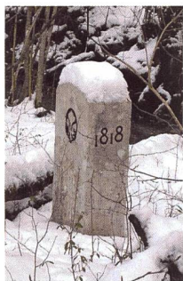
Figure 1: Borne 158 Ain-Genève

Les quelques 450 bornes-frontières qui séparent le canton de Genève de la France vieillissent. Pour la moitié d'entre-elles datant de près de deux cents ans, ces blocs de calcaire avaient bien besoin d'un rafraîchissement. La fondation Re-Borne, créée à l'occasion du bicentenaire de l'entrée de Genève dans la Confédération, a récolté des fonds pour permettre la restauration de ce patrimoine.