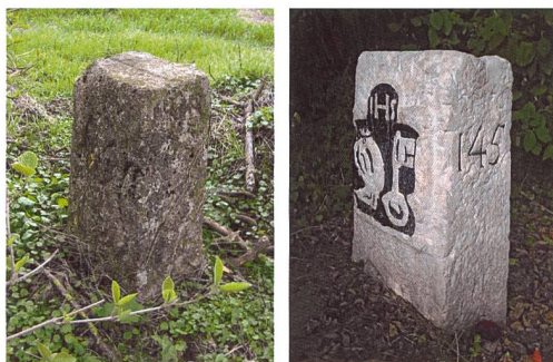
Figure 5: Borne 145 Ain-Genève