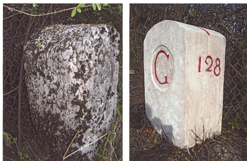
Figure 4: Borne 128 Ain-Genève