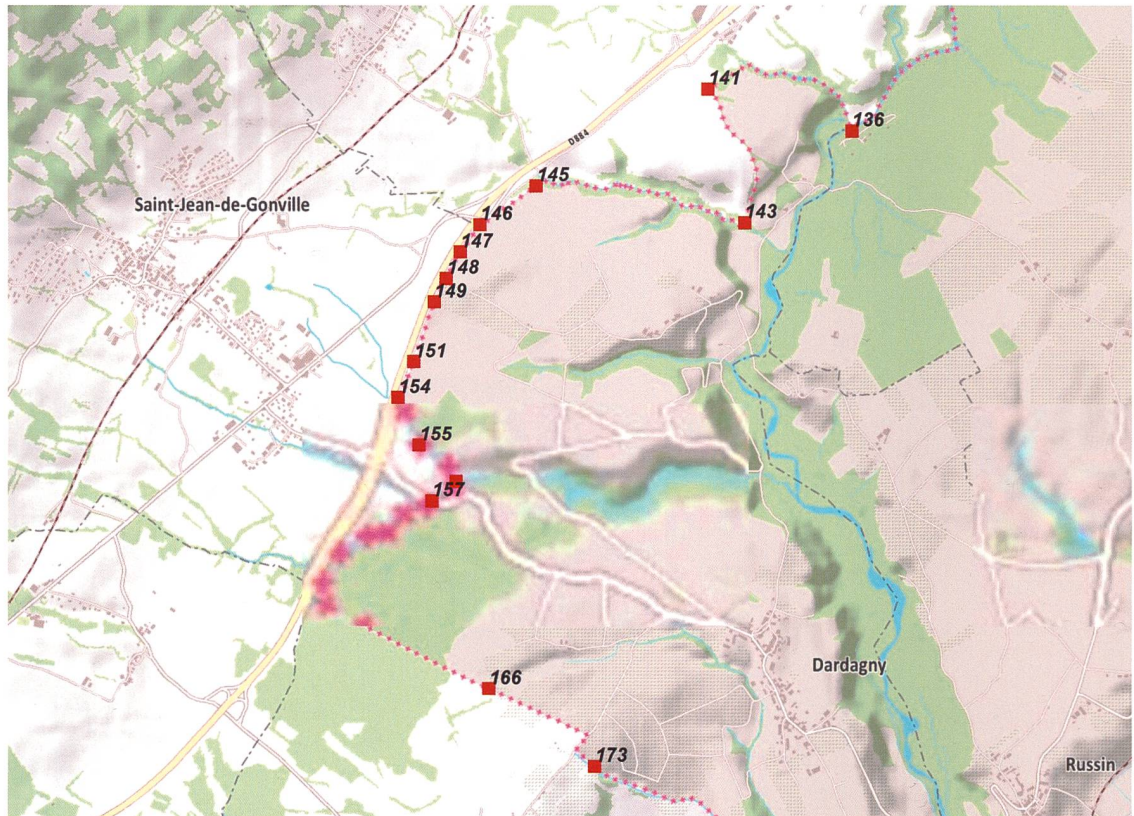
Figure 3: Carte figurant les repères à restaurer en frontière sur la commune de Dardagny

La restauration complète d'une borne-frontière en pierre représente un coût d'environ CHF 4000. Avec les budgets annuels alloués aux cantons en frontière, ce ne sont qu'une à deux bornes-frontières du secteur genevois qui peuvent être remises en état selon les finances franco-suisse disponibles. Or à ce jour, ce sont plus de 40 bornes-frontières qui nécessitent une restauration complète. Avec les budgets alloués, la restauration s'étalerait sur plus de 10 ans. Le projet de la fondation Re-Borne est donc une formidable opportunité d'accélérer la réparation de ces bornes.