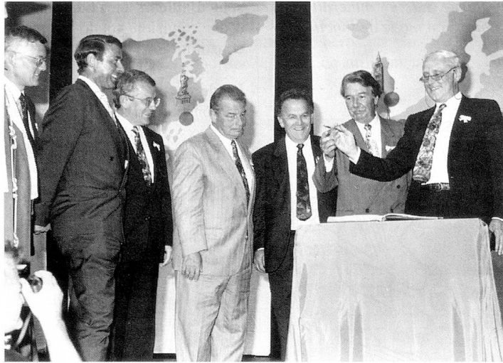
Tous les conseillers fédéraux inscrivent leur nom dans le livre des visiteurs.

Suisse et l'Europe. Etant donné les décisions historiques que les Suisses devront prendre, il a appelé les Suisses de l'étranger à faire un usage systématique de leur nouveau droit de vote par correspondance et à donner l'exemple, à leurs concitoyens au pays, d'une très forte participation.