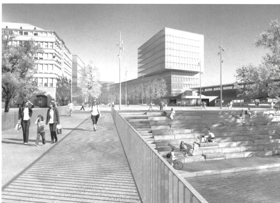
Visualisierung des neuen Stadtteils HB Südwest.