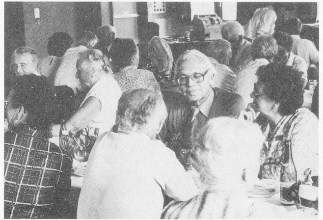
Leise Wehmut vielleicht, aber auch Zufriedenheit und Behagen, Überschrift: In Dankbarkeit geniessen wir's!