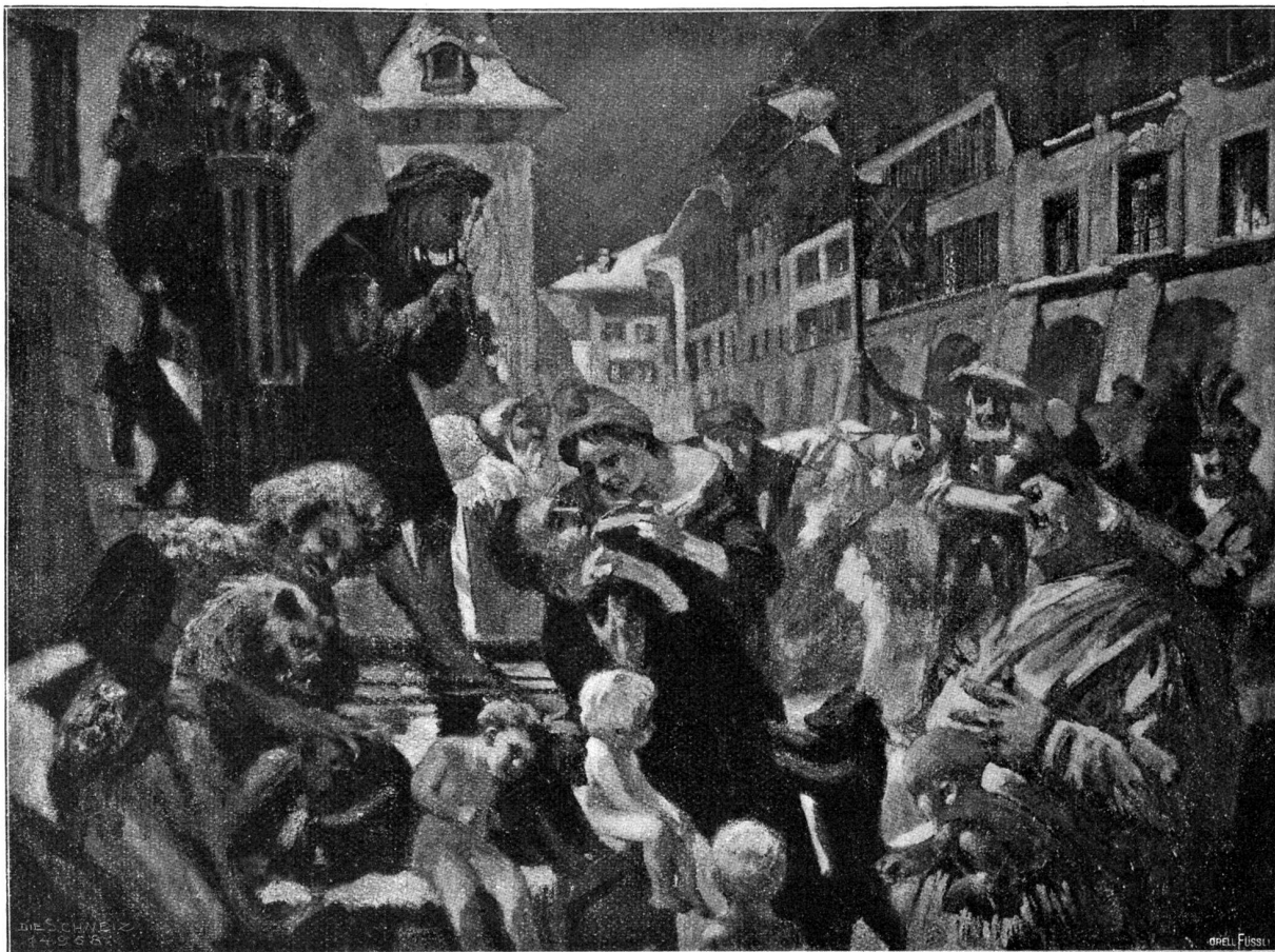
Silvesterpuk. Nach dem Gemälde (1898) von Hans Beat Wieland, Basel-München.

turm und alles war reich geschmückt, zum Teil vom vergangenen Osterfest her, zum Teil mit frischen Reisern. Innerhalb der Mauer standen die Dienstleute vom Schloß und viele Menschen aus den nahen Dörfern, die den Zulach verpflichtet waren. Ein Chor von Mädchen sang: