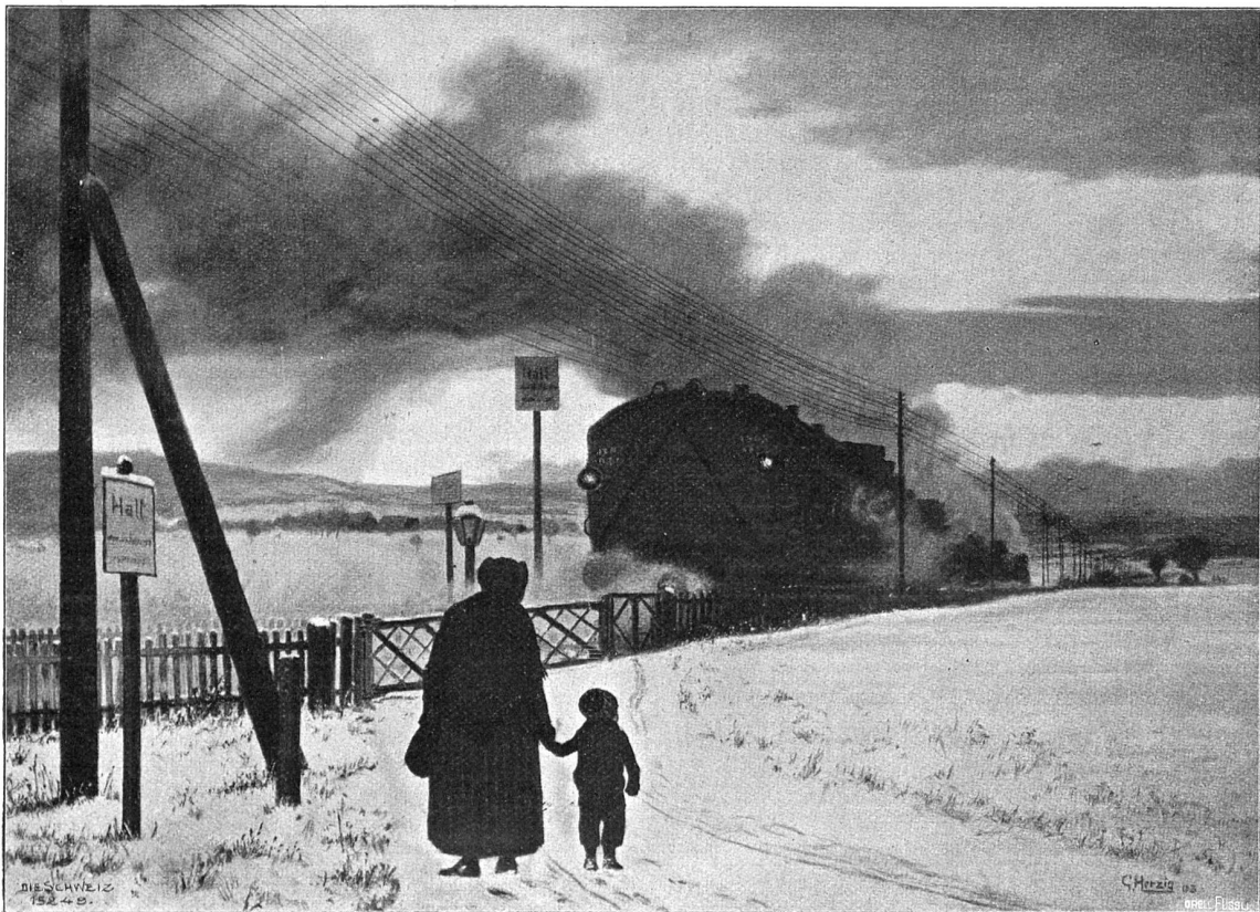
Schnellzug. Nach dem Gemälde von Gottfried Herzog, Wienbach.

Wieder bohrten sich ihre Augen in die seinen, und nun las er in ihrem Blick eine feierliche Entschlossenheit. Er verstand sie; aber er wollte doch noch einmal prüfen.