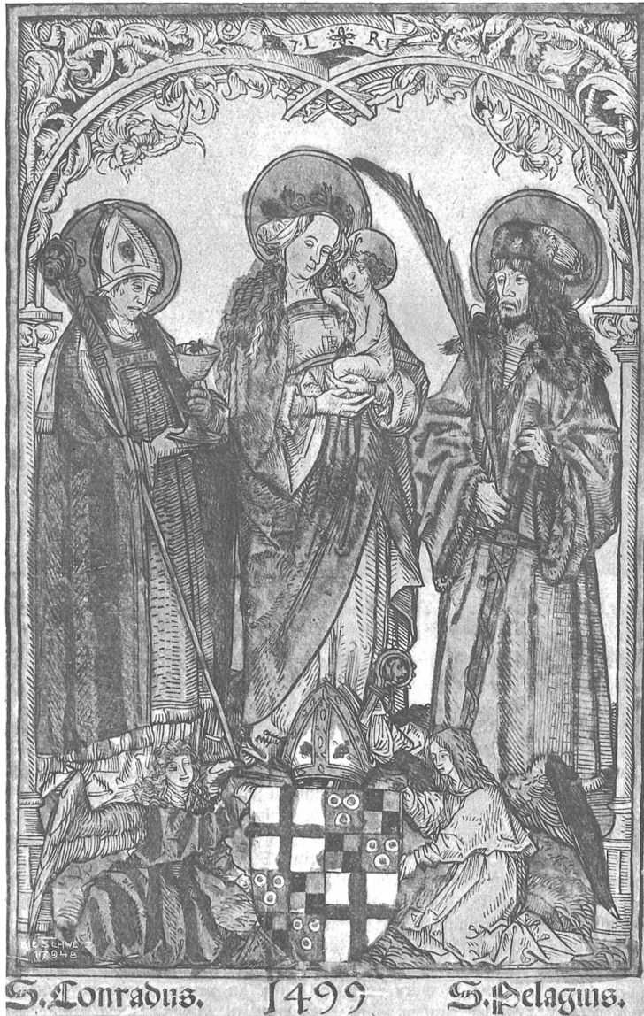
Buntbemalter Holztafelruck von 1499. Neuerwerbung des Schweiz. Landesmuseums in Zürich.