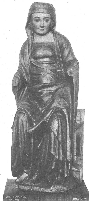
Madonna, bemalte Holzskulptur aus der Umgebung des Klosters Engelberg. Neuerwerbung des Schweiz. Landesmuseums in Zürich.

Das Hauptstück ist eine Madonna mit Christuskind in zweidrittel Lebensgröße aus der Innerschweiz. Sie dürfte zu den interessantesten Holzskulpturen gehören, die nicht nur in unserm Lande, sondern überhaupt aus der ersten Hälfte des vierzehnten Jahrhunderts erhalten blieben, weniger wegen der Formenschönheit der Körper, in denen ein freundlicher Gesichtsausdruck noch durch ein steifes Lächeln, wie es frühmittelalterlichen Werken eigen ist, zur Darstellung gebracht wird, als vielmehr wegen der noch vorzüglich erhaltenen alten Bemalung, die sich allerdings nur mit viel Mühe und Sorgfalt nach Entfernung zweier späterer Anstriche wieder völlig bloßlegen ließ. Wieviel mehr Aufmerksamkeit man zu jener Zeit der technischen Behandlung der Bemalung schenkte als am Ende des Mittelalters, geht am deutlichsten durch einen Vergleich dieses Bildwerkes mit den Schnitzereien hervor, die zu Ende des fünfzehnten und am Anfang des sechzehnten Jahrhunderts als Mas-