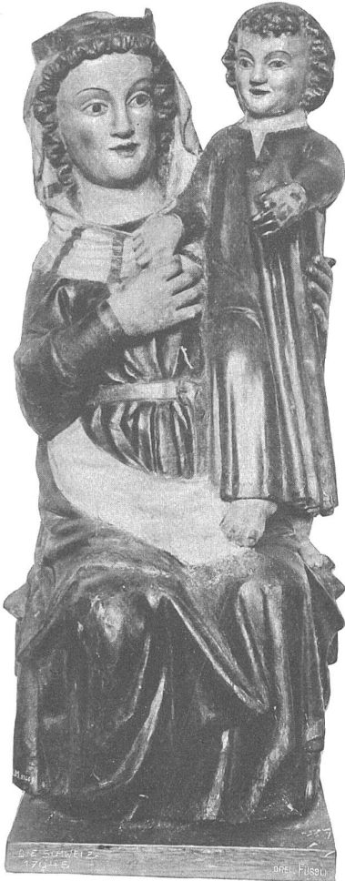
Madonna mit Christuskind in \frac{2}{3} Lebensgr., bemalte Holzskulptur aus der Innerschweiz (1. Hälfte des XIV. Jahrh.). Neuerwerbung des Schweiz. Landesmuseums in Zürich.