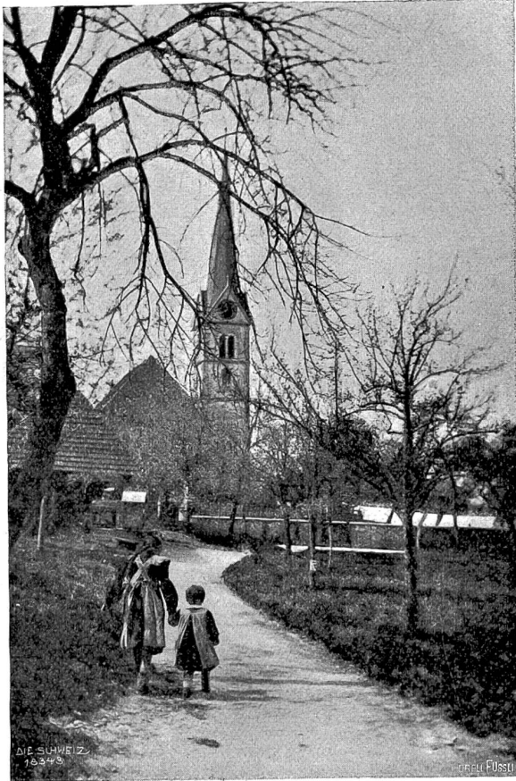
Kirche von Herzogenbuchsee, für die Eugène Burnand Glasgemälde entworfen hat.

mit der Chaise bestellt werden — denn daß der Gast den romantischen Hügelweg hinauf oder hinunter auch zu Fuß gehen könnte, kam nicht in Betracht — hernach wurde wohl auf diplomatischem Wege der erwähnte Hausgeist für Beschaffung eines Mittagmahles von mindestens zwei Gängen mit Zubehör vorbereitet und gewonnen, auch dann, wenn der Gast extra erklärt haben sollte, daß er erst nach Tisch ankomme. „Nach Tisch“: eben das war ja Viktoria Dübelsbeißens Kummer; denn da in Chalet Rischmatt nie jemand wußte, wann Tisch war, indem die Herrin zu ganz verschiedener Stunde, manchmal überhaupt nicht dazu erschien, wer hätte da bestimmen können, auf welche Tageszeit „Nach Tisch“ anzusehen war! So mußte ich einmal lange nach drei Uhr und ausdrücklich schon gegessen habend, doch alle Vorbereitungen und hernach das ganze Mittagessen an mir vorübergehen lassen, was zwar im freundlichen Eßzimmer mit dem freien Blick weit über die grünen Felder und neben der noch freundlicheren Gastgeberin durchaus keine Zumutung bedeutete. Als wir aber endlich glücklich am gedeckten Tisch saßen und eben beten wollten, da fehlte richtig das Marieli, die alte treue, noch aus dem gemeinsamen Haushalt herübergenommene, jetzt halb blinde und taube Magd, die von ihrer Herrin bis zum Tode gepflegt wurde. Wo war das Marieli? Es hatte sich natürlich aus Bescheidenheit in irgend einen Winkel verkrümelte, wurde nun