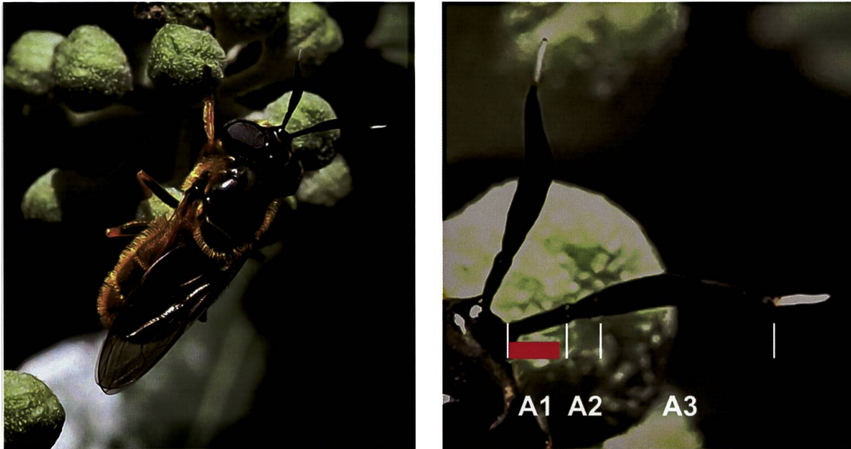
Abb. 1: Callicera macquarti (Weibchen) am 1.9.2020 an Efeu ( Hedera helix) in Brissago (TI). Der Ausschnitt rechts zeigt die charakteristischen Antennensegment-Längen sowie das Verhältnis der maximalen Scutellum-Haarlänge (roter Balken) zu A1.