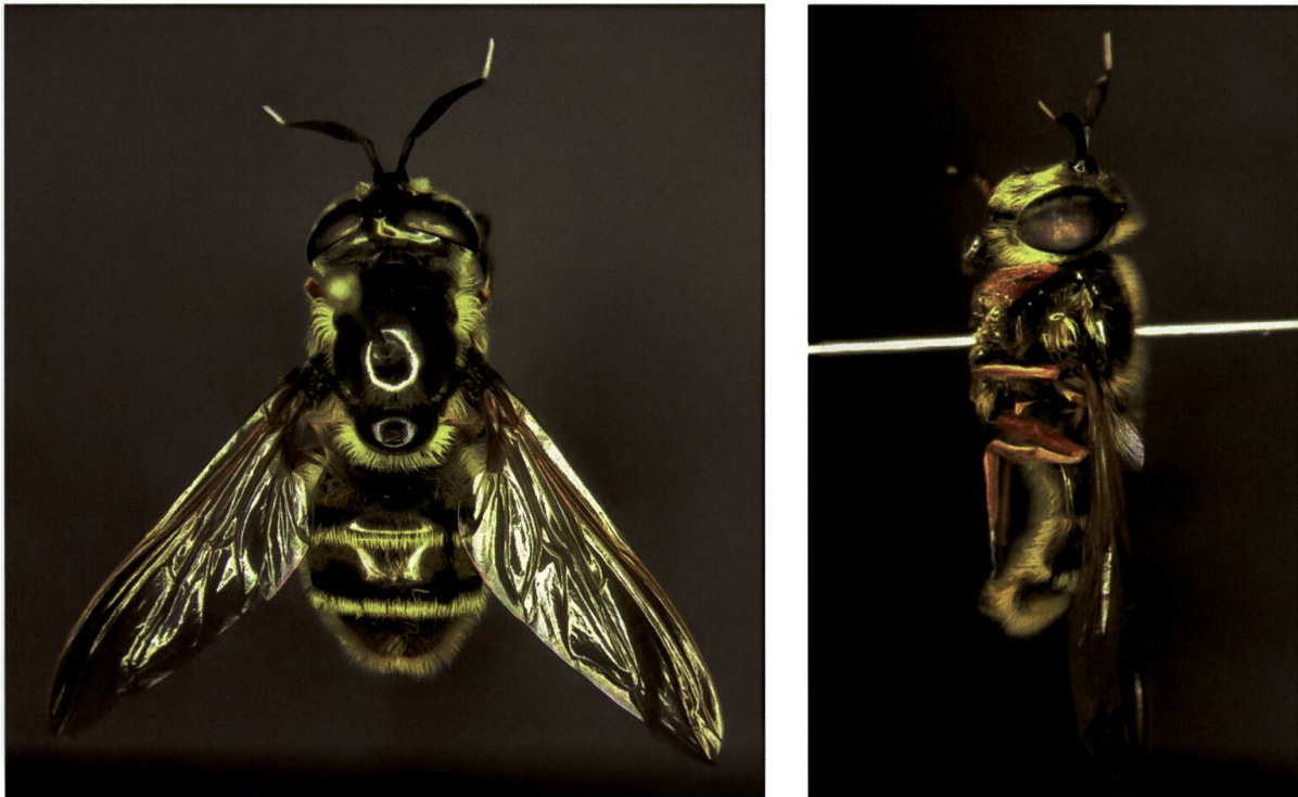
Abb. 2. Callicera spinolae (Weibchen) aus der Sammlung des Naturhistorischen Museums in Bern (leg. Jacqueline Grosjean).