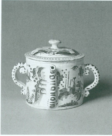
5. Inv. AR 2000-71, voir STURM-BEDNARCZYK 1994, p. 110 (repr. coul.)

facture de Du Paquier ne se contenta pas de plagier Meissen : à certains égards, il semble même qu'elle prit de l'avance sur sa prestigieuse rivale, notamment par la maîtrise du décor polychrome. Vienne, apparemment, disposait d'une palette d'émaux complète dès 1720, alors que Meissen n'y parvint qu'à partir de 1723 ou 1724.