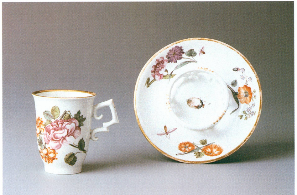
3. Manufacture Du Paquier, Vienne Tasse trembleuse et soucoupe , 1735-1740 porcelaine, décor peint aux émaux polychromes et à l'or, haut. 8,3 cm (MA, inv. AR 2000-71)