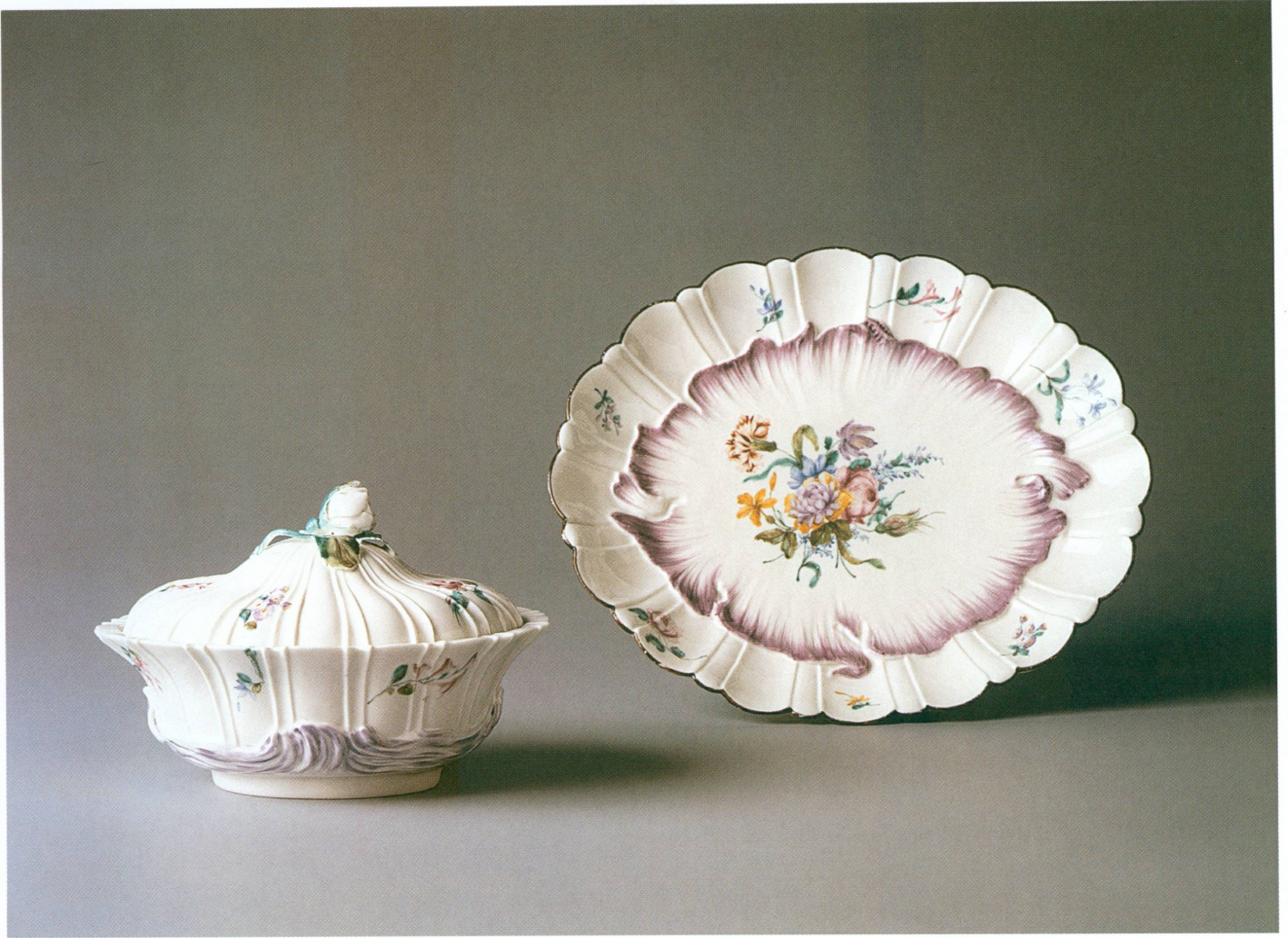
2. Manufacture de Chantilly | Sucrier de table et présentoir , vers 1755 | porcelaine tendre, décor peint aux émaux polychromes, larg. 24 cm (MA, inv. AR 2000-72)