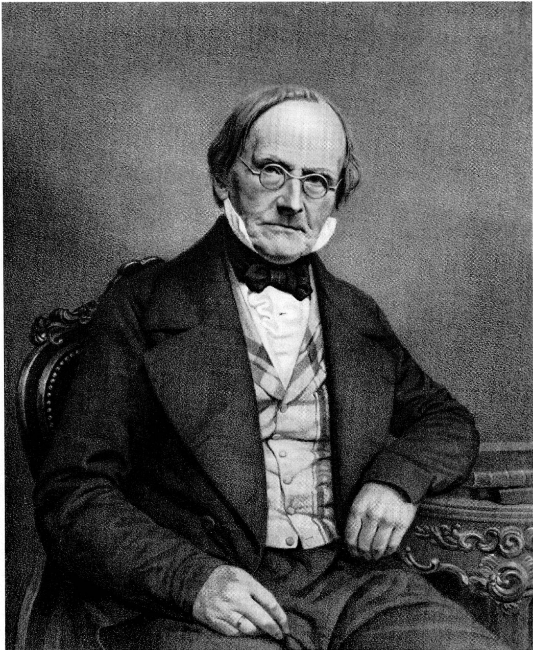
Abb. 1. Jean de Charpentier (1786–1855). Lithographie Vorlage im Naturhistorischen Museum Bern