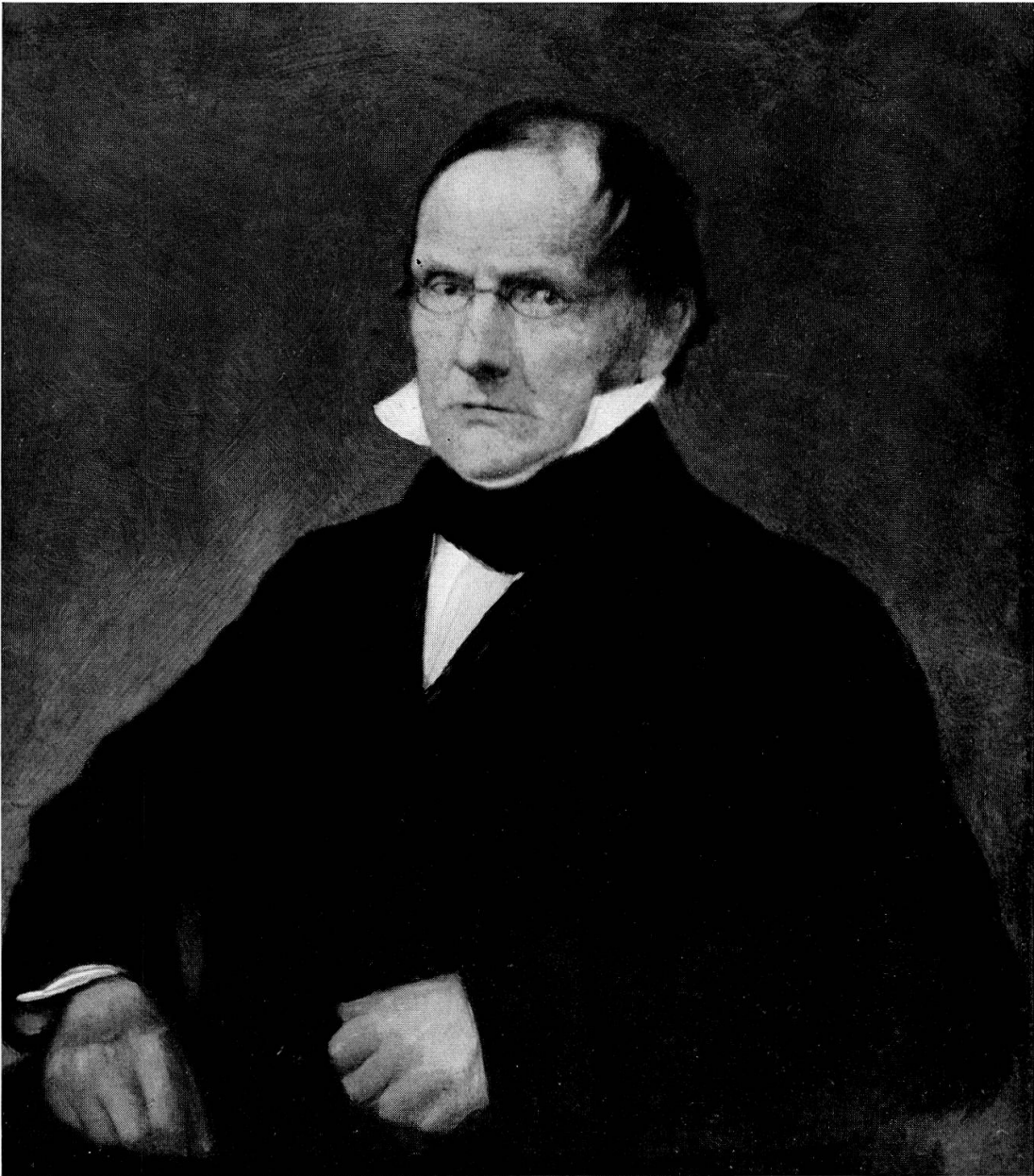
Abb. 2. Jean de Charpentier. Gemälde. Original im Naturhistorischen Museum Bern