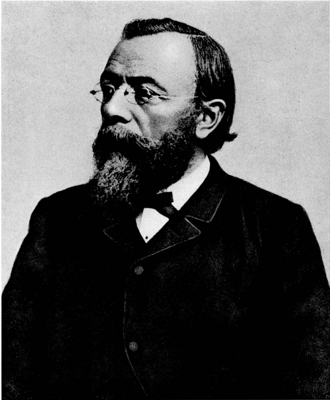
Prof. Dr. Lichnerowicz