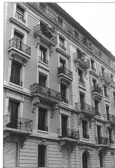
Plantamour, un succès mais...

Bâle-Ville est le canton en Suisse qui compte, relativement, le plus grand parc de logements coopératifs avec 10,33% du parc sous cette forme. Non seulement il s'agit là d'un canton entièrement urbanisé, mais en plus le gouvernement cantonal et Coop Bâle ont longtemps poursuivi une politique de promotion de coopératives d'habitation. La stratégie, typiquement bâloise, consistait à fonder une