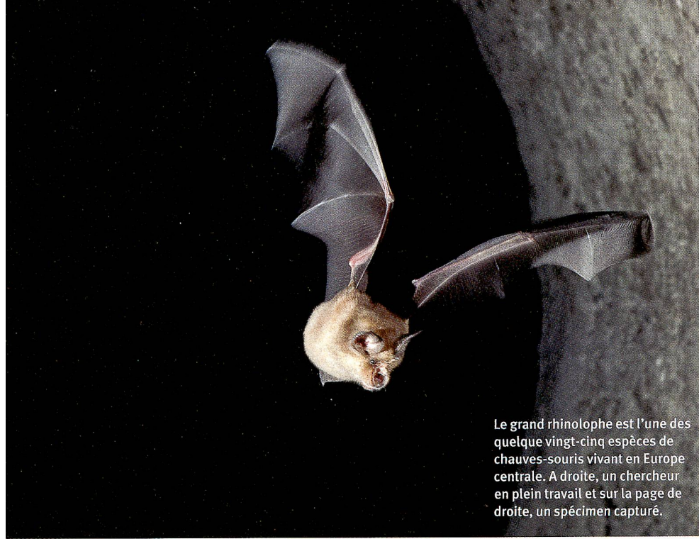
Le grand rhinolophe est l'une des quelque vingt-cinq espèces de chauves-souris vivant en Europe centrale. A droite, un chercheur en plein travail et sur la page de droite, un spécimen capturé.