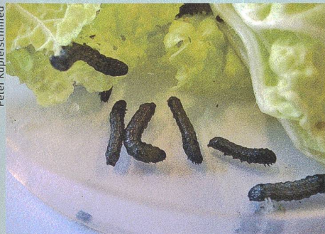
Des chenilles ravageuses ingèrent des feuilles qui ont été traitées avec des bactéries insecticides.