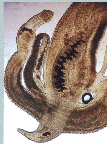
Parasites en action. Des vers à l'origine de la bilharziose.