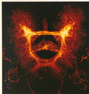
Gehirn eines Drosophila -Embryos, so gross wie ein Hunderstel eines Stecknadelkopfes.

Die Neuroforschung beschäftigt sich sehr intensiv mit der Frage, welche molekularen und genetischen Mechanismen die Entwicklung des menschlichen Gehirns steu-