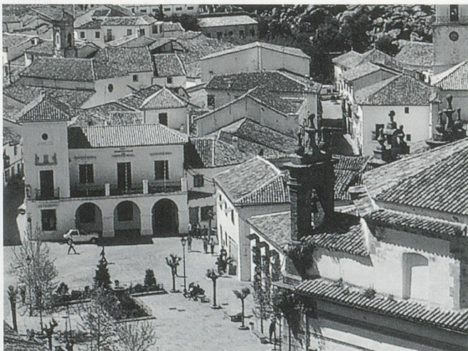
Ein weisses Dorf: Blick auf den Marktplatz von Grazalema

Diese Reise wird durch ARCATOURE in Zusammenarbeit mit dem Zuger Vogelschutz und der Pro Senectute organisiert.