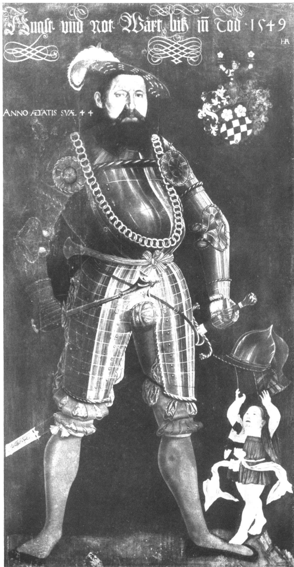
Oberst Wilhelm Frölich, Ritter 1504 — 1562