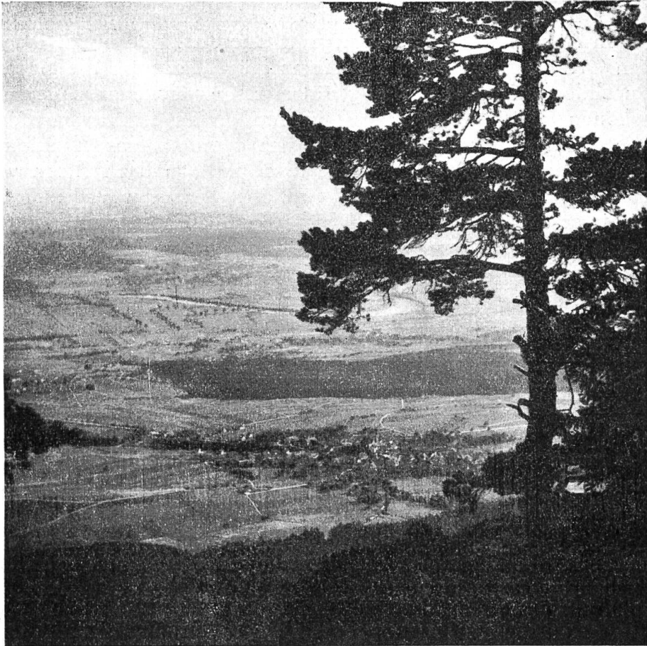
Blick vom Nesselboden auf Oberdorf.