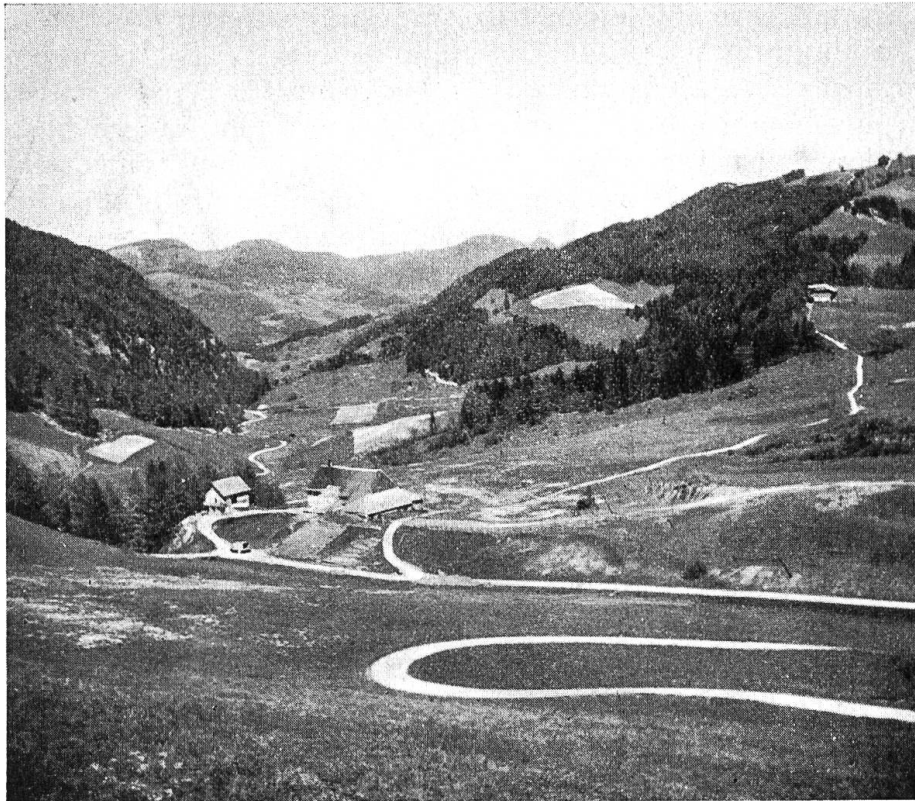
Blick ins Guldental.

wenn sie mehr zu Hause blieben, in der Familie, am Werktag und am Sonntag? Zwar wirst du sagen: Immer gab es Zugvögel, die das unruhige Blut forttrieb, in die Fremde, in den Söldnerdienst, nach Amerika; aber wer ein Heim hatte, ein Stück eigenen Boden, der schmiedete sich sein Glück in den Grenzen der Heimat, in der Werkstatt, suchte den Boden zu bebauen, den sein Vater gerodet. Der Krieg hat unsern Grenzhaag geschlossen. Heimat bedeutet mehr als in Zeiten, da das Ausland offene Türen hatte. Darum bedeutet manchem von uns der Ort, wo wir wohnen, heute mehr als gestern.