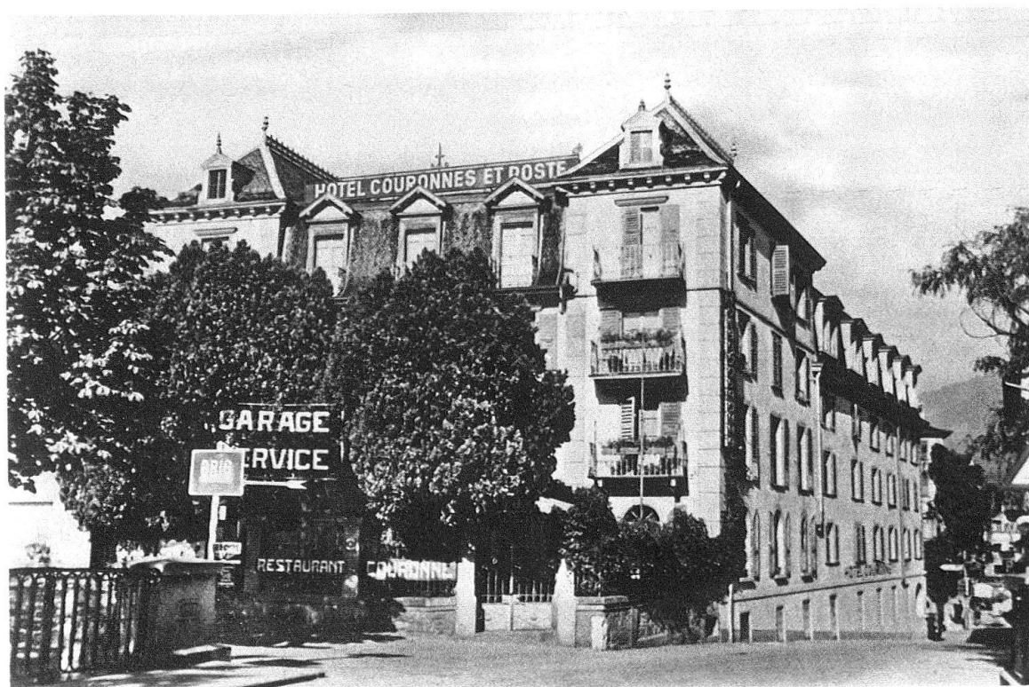
Abb. 5. Brig. Hotel «Couronnes et Poste» nach dem historistischen Umbau von 1901. Ansicht von Westen