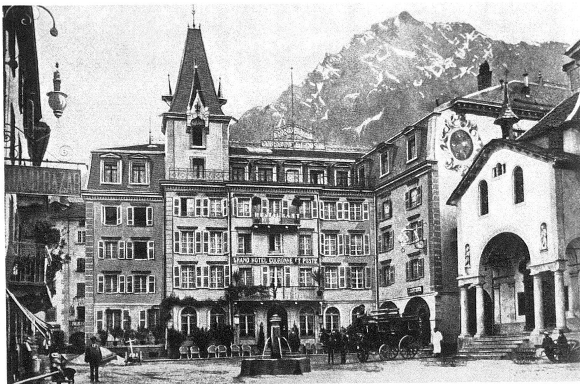
Abb. 4. Brig. Hotel «Couronnes et Poste» nach dem historistischen Umbau von 1901 (Aufnahme in einem Album, betitelt «Hotels, Pensionen u. Bergbahnen der Schweiz, Lago Maggiore, Como u. Garda, incl. Mailand in Wort u. Bild». Edition C. Zündorf, Zürich I, Buchdruckerei G. Meyer, Zürich V, o.J.)