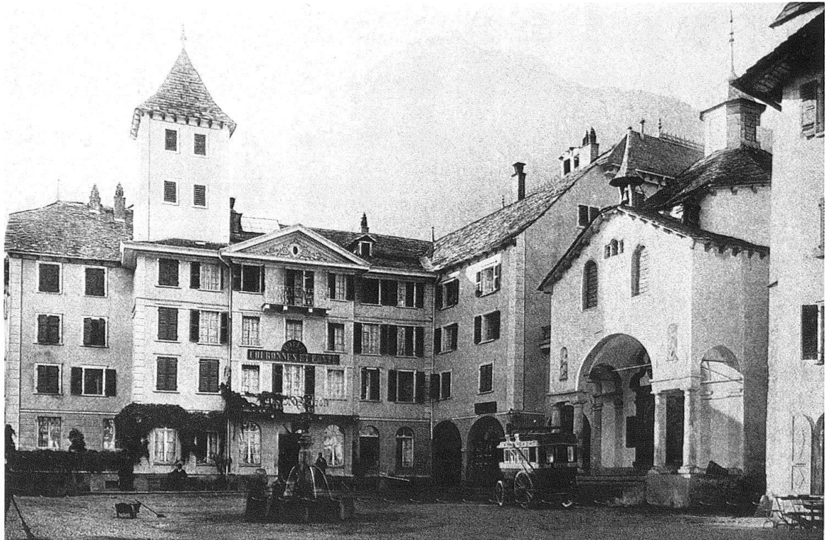
Abb. 3. Brig, Hotel «Couronnes et Poste» vor dem Umbau von 1901

chen hätte. Für diesen Sachverhalt spricht die Tatsache, dass man beim Abbruch des Flügels auf alte Dielbäume stiess, die nach damaliger Ansicht bis auf die «Klosterzeit» des Bauwerks zurückgereicht haben könnten – nach der mündlichen Überlieferung soll das Haus einst nämlich ein Kloster gewesen sein. Auch klaffte zwischen dem Flügel und dem Treppenturm keine Baunaht.