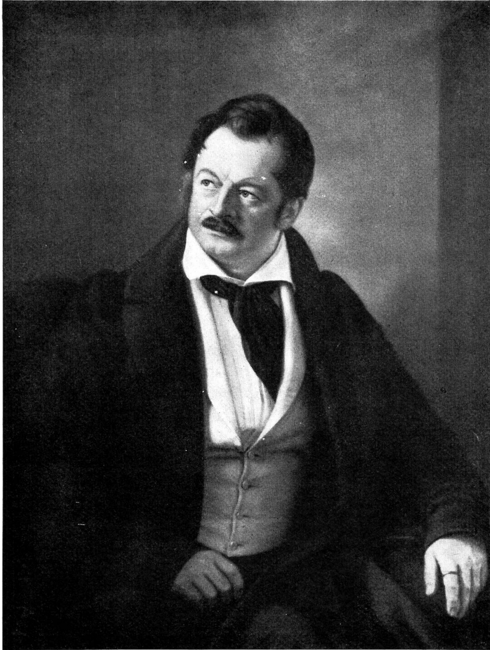
Johann Rudolf Ringier (1797–1879)