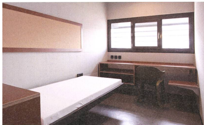
Die kargen Zellen bieten nur das Nötigste.

Im Erdgeschoss wurden 10 Räume für den Kontakt der Insassen mit Besuchern erstellt, davon 4 mit Trennscheiben. 7 weitere Räume stehen den Besuchen von Staatsanwaltschaft, Polizei, Gericht, Rechtsanwälten usw. zur Verfügung. Natürlich umfasst das Raumprogramm auch Büroräumlichkeiten für die Verwaltung. Arbeitsräume, Werkstattbüros, Lager, Hauswirtschaft, Haustechnik und Entsorgung belegen weitere Räume.