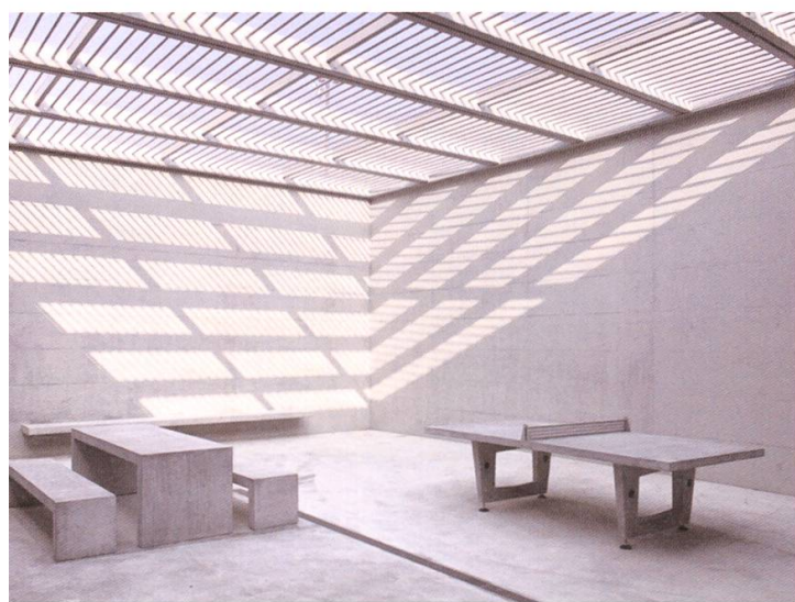
Die Spazierhöfe sind mit Gittern gedeckt.

Insbesondere wurde von Seiten der Vollzugsbehörden eine spezielle Infrastruktur für die zunehmende Zahl (25 Prozent) verhaltensgestörter oder persönlichkeitsgestörter Gefangener gefordert. 2003 machte der damalige Strafanstaltsdirektor Martin-Lucas Pfrunder im Verein mit Regierungsrat Kurt Wernli die Öffentlichkeit darauf aufmerksam, dass das Zentralgefängnis auch Platz für psychisch kranke Häftlinge bieten soll. Der Innendirektor hoffte damals auf einen Eröffnungstermin 2008/09.