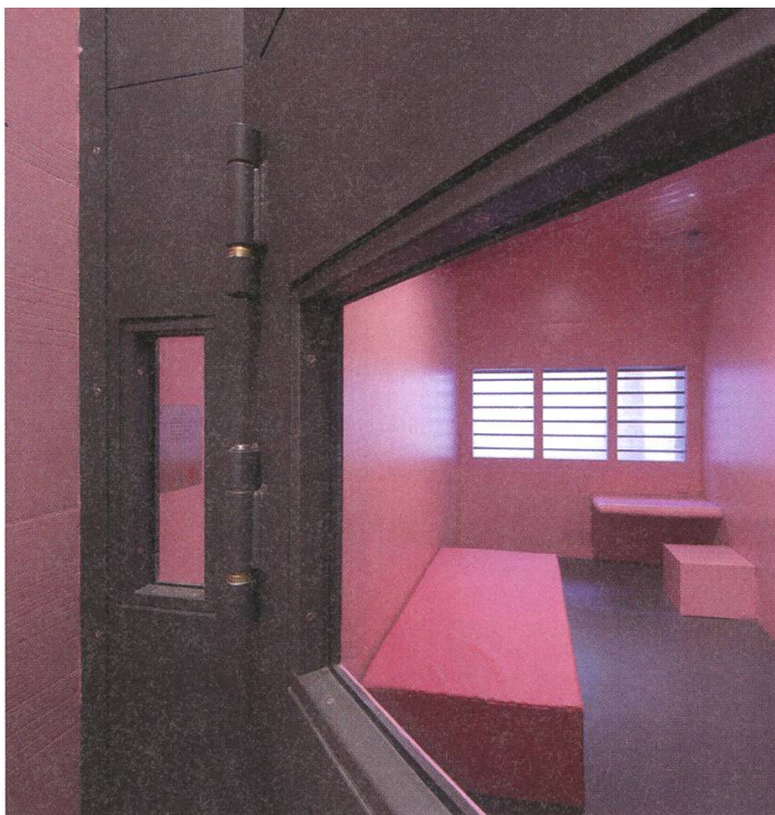
Die Pinkzelle beruhigt renitente Gefangene.

Hirn der ganzen Anlage ist die Loge (Überwachungszentrale), welche 365 Tage im Jahr und 24 Stunden im Tag besetzt ist.