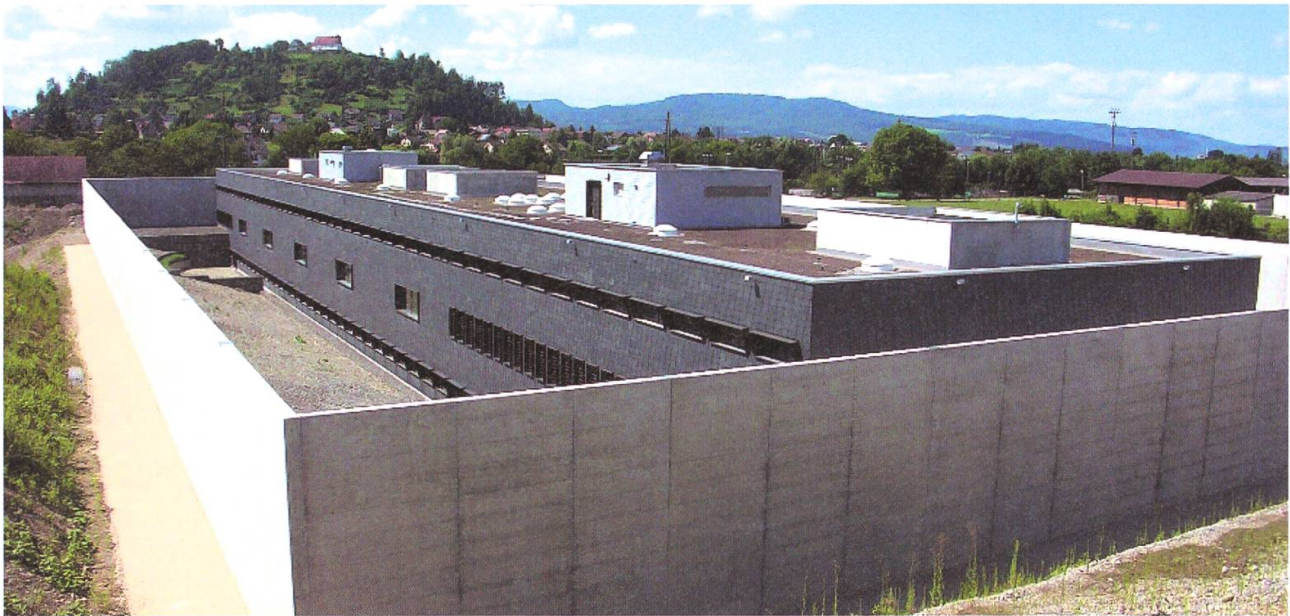
Das Zentralgefängnis, 118 Meter lang und 24 Meter breit, duckt sich in die alte Kiesgrube.

geschoss, von welchem hinter der Umfassungsmauer nur die Aufbauten für Spazierhöfe, Technik und Oblichter in Erscheinung treten. Sicherheit hat erste Priorität. Wer als Sträfling hereinkommt, kommt von selber nicht mehr heraus – da hätte selbst der Matter keine Chance. Die Kunden werden mit einem Polizei-Transportfahrzeug gebracht, in einer speziellen Schleuse in Empfang genommen und im Kontrollraum Gefangene und Gepäck durchsucht. Der Zugang ins Innere des Gefängnisses ist nur mittels Irisleser (Augen-Scanner) möglich, registriert sind ausschliesslich Mitarbeitende der JVA. Für den Ein- und Austritt gibt es besondere Wartezellen. Im Eintrittsbüro erfolgen Erfassung, Leibesvisitation, Fotografie und Aufnahme der Personalien. Die persönlichen Effekten der Gefangenen werden in einem speziellen Lagerraum aufbewahrt, Risikogegenstände wie Mobiltelefone, Schlüssel, Sackmesser usw. kommen nicht in die Zellen.