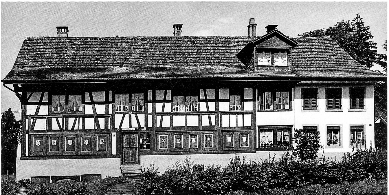
Bau- und Besitzgeschichte des Ortsmuseums Hinwil, erbaut 1718, letztmals erweitert 1832.