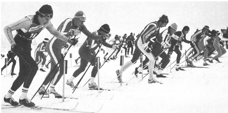
Départ de la course de relais (championnats de Suisse 1984, à Mont-Soleil).

Nous l'avons déjà dit, les « pionniers » du ski de fond participaient, de leur temps déjà, à des compétitions entre pays voisins. Mais, pour connaître la valeur internationale réelle des spécialistes suisses, il faut se référer aux grands concours mettant aux prises l'ensemble des nations pratiquantes. On dut bien quelque peu déchanter, par exemple, après les premiers Jeux olympiques de Chamonix, où les représentants suisses avaient été fort modestes. Il est pourtant intéressant de constater que l'échec des « civils » y fut une fois encore compensé par le succès des patrouilles militaires.