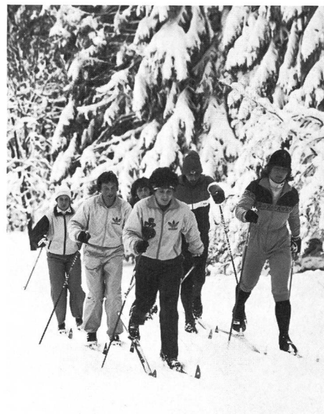
LLL: pour vivre plus longtemps?...

Au début des années 60, le public s'est enfin approché du ski de fond, tout d'abord en spectateur, aux abords des pistes sur lesquelles se déroulaient des compétitions, puis comme «pratiquant», les femmes se mettant, elles aussi, à chausser les lattes. Sa popularité, le ski de fond la