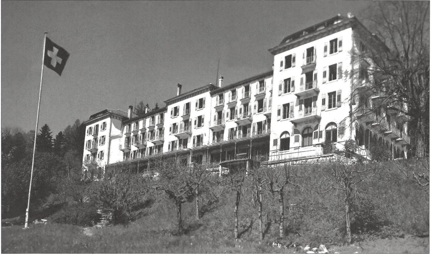
Sorte de maison de nobles, le Grand Hôtel de Macolin avait été construit pour accueillir une clientèle en mal de solitude et... d'oxygène. Elle était essentiellement française...