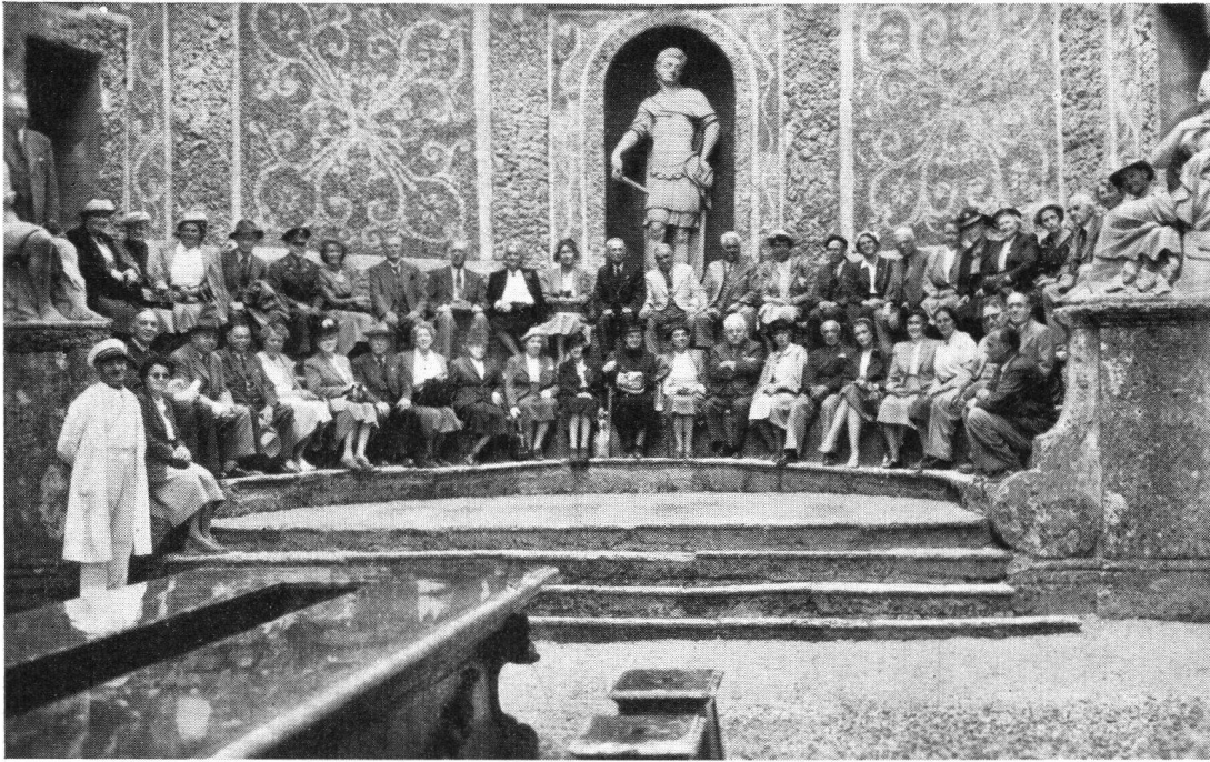
Eine Partie der Teilnehmer im Schloßpark von Hellbrunn

(Von dieser Aufnahme sind der Geschäftsstelle des Burgenvereins 20 Exemplare zugestellt worden. Wer ein Bild wünscht, beliebe Fr. 1.40 in Briefmarken einzusenden)