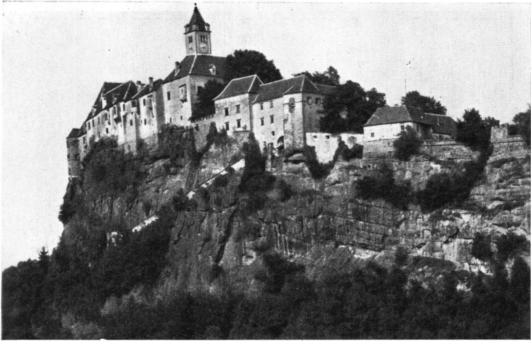
Die imposante Riegersburg in der Steiermark