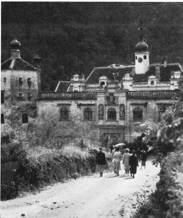
Besuch beim Grafen von Herberstein

(Von dieser Aufnahme sind der Geschäftsstelle des Burgenvereins 20 Exemplare zugestellt worden. Wer ein Bild wünscht, beliebe Fr. 1.40 in Briefmarken einzusenden)