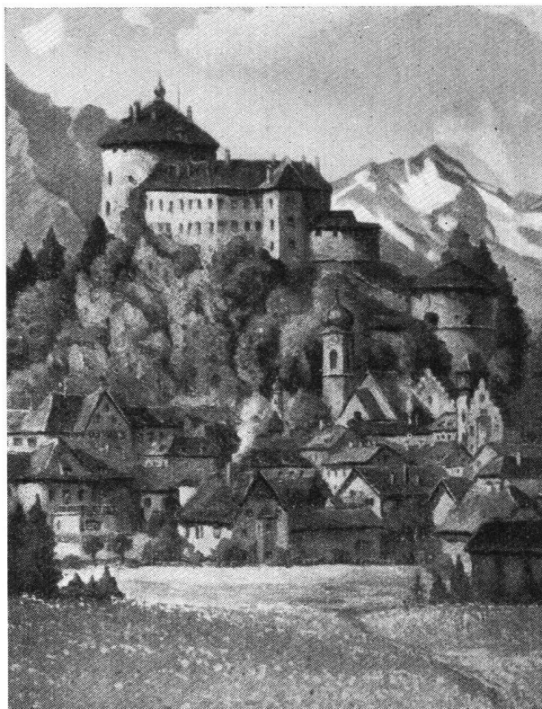
Burg Geroldseck ob Kufstein (Tirol)