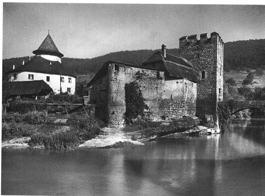
Schloss Zwingen, links Hauptburg, rechts Vorburg mit Torturm, Zustand um 1930.

Im territorialpolitischen Gefüge des Bischofs klaffte um 1280 allerdings eine Lücke, die sich auf die Dauer als verhängnisvolle Schwachstelle hätte erweisen können. Im Laufental unterstand dem Bischof bloss die Lehns Gewalt über einige, oben genannte Adelherrschaften. Deren Inhaber erfreuten sich aber einer weitgehenden Autonomie, die schlecht zu den landesherrlichen Ambitionen des Bischofs passte. Wohl gelang es diesem, das ehrgeizige Projekt der Ramsteiner, in Zwingen eine kleine Stadt zu gründen, rechtzeitig abzublocken und sich mit dem lehnsrechtlichen Vorbehalt des Heimfalls die Anwartschaft auf eine Übernahme Zwingens in seine direkte Verwaltung zu si-