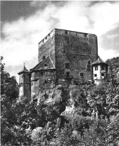
Schloss Angenstein, Aufnahme um 1930.

schaftlichen Güterverbandes, dessen Umriss sich im nachmaligen Amt Laufen abzeichnen, welches die Dörfer Liesberg, Bärschwil, Röschenz und Wahlen umfasste. Den frühmittelalterlichen Ursprung des Güterverbandes belegt dessen Verbindung mit der Martinskirche von Laufen, einer Urfparrei, zu deren Sprengel das ganze Laufental gehörte. In der nächsten Umgebung der auf einem Hügel rechts der Birs gelegenen Martinskirche ist denn auch der Standort des alten Herrenhofes zu suchen. 15