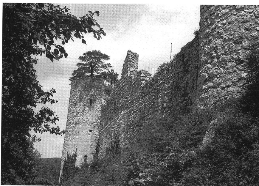
Burgruine Dorneck, Aufnahme 1975.

chern. Westlich von Zwingen sah es mit der bischöflichen Machtstellung bedenklicher aus: Der Blauen bildete mit den Reichsdörfern Eigengut der Herren von Rotberg, und südlich der Birs begann bei Breitenbach das unter thiersteinischer Kastvogtei stehende Klostergebiet von Beinwil. Zwischen den Thiersteiner und den Rotberger Besitz zwängte sich als schmaler Korridor das Gebiet des Dinghofes von Laufen, und ausgerechnet über dieses verfügte der