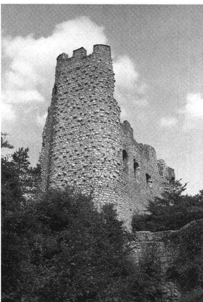
Pfeffingen, Wohnturm, Aufnahme 1975.

Im Sisgau gelang es den Bischöfen, die Lehnsgewalt über die frohburgischen Herrschaften Liestal, Homberg und Waldenburg zu erwerben, nachdem sie schon früher die frohburgischen Ansprüche auf Arlesheim und Birseck abgewiesen hatten. Im unteren Birstal stellten sich zu nicht näher bestimmbarer Zeit, wohl zwischen 1260 und 1300, die Herren von Ramstein mit den Burgen Gilgenberg, Zwingen und Ramstein unter die Lehnshoheit des Bischofs, die Grafen von Thierstein mit der Burg Pfeffingen, aber nicht mit