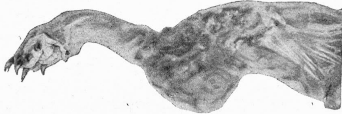
Abb. 2. Vorderbein des Meerschweinchens mit starker Schwellung des Ellbogengelenkes.

Neu sind aber jedenfalls die Beobachtungen über multiple Erkrankungen der grossen Gelenke beim Meerschweinchen. Abbildung 2 zeigt eine Affektion des Ellenbogengelenkes bei einem Meerschweinchen, das pasteurisierte Milch als Beinahrung erhielt. Ausser dem abgebildeten Gelenk