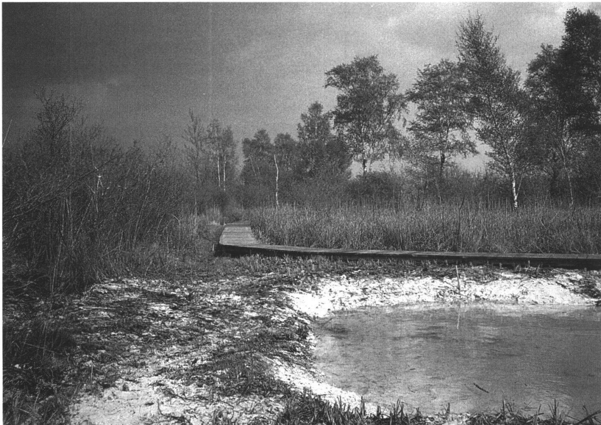
Abbildung 10: Riedlehrpfad in der Hechtenbucht mit Weiher und Bretterpfad. Er gewährt den Besuchern gezielt Einblick in das Ried. (Foto A. Bossert, 21. März 1990)

Seit dem Frühjahr 1989 führt die Ethologische Station Hasli der Universität Bern an verschiedenen Gewässern u.a. auch im Naturschutzgebiet St. Petersinsel und Heidenweg eine mehrjährige Untersuchung zur Thematik «Freizeitaktivitäten und Wasservögel» durch. Die Arbeiten stehen unter der Leitung von Prof. P. INGOLD und zeigen beispielsweise die Auswirkungen von Bootsfahrverboten auf Wasservögel auf. Erste Ergebnisse der Untersuchungen von M. ROTH und A. RAWYLER am Bielersee weisen darauf hin, dass sowohl die Nestdichte wie auch die Distanz der Nester des Haubentauchers zum offenen Wasser vom Bootsbetrieb abhängig sind. Je grösser die Störung, desto weiter im Schilf (ausser Sichtweite) bauen die Haubentaucher ihre Schwimmnester. Die weiter landeinwärts liegenden Nester können trocken fallen und die Eier ausgeraubt werden. Der Bruterfolg ist demnach in ungestörten Bereichen grösser: In der am stärksten belasteten Bisenbucht gingen 1989 92% der Eier verloren; am Südufer des Heidenweges waren es 79%. Die Jungenverluste waren in der Schutzzone am geringsten, höchstwahrscheinlich weil sich hier die Haubentaucherfamilien ohne Störungen entwickeln konnten. Die vollen Auswirkungen der Schutzzone am Heidenweg dürften