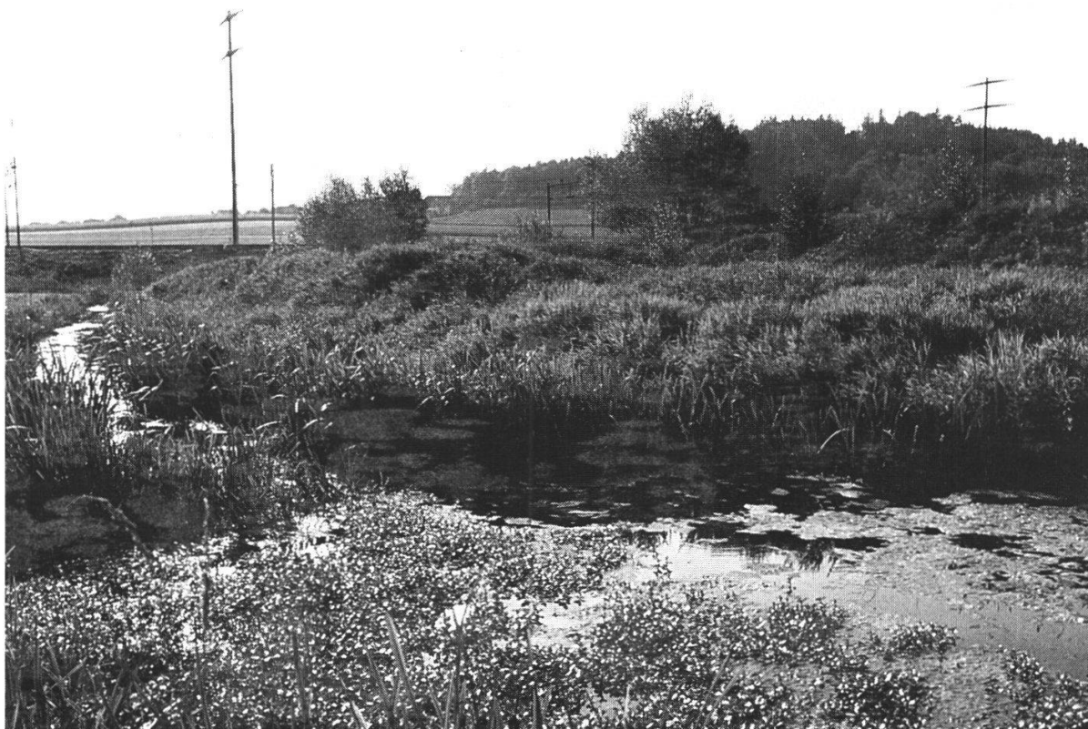
Abbildung 7: Blick gegen Südwesten im Naturschutzgebiet Rüfenachtmoos. Im Vordergrund ein Wassergraben, im Hintergrund das ehemalige Deponiegelände, ein Mosaik verschiedener Lebensräume. (Foto D. Forter, Oktober 1984)