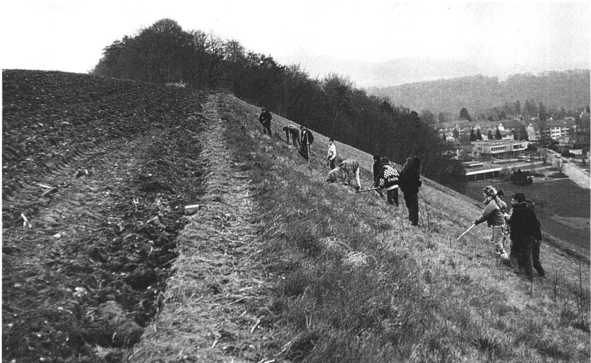
Abbildung 11: Zwei Schulklassen von Bremgarten pflanzen unterhalb der Hangkante eine Hecke.