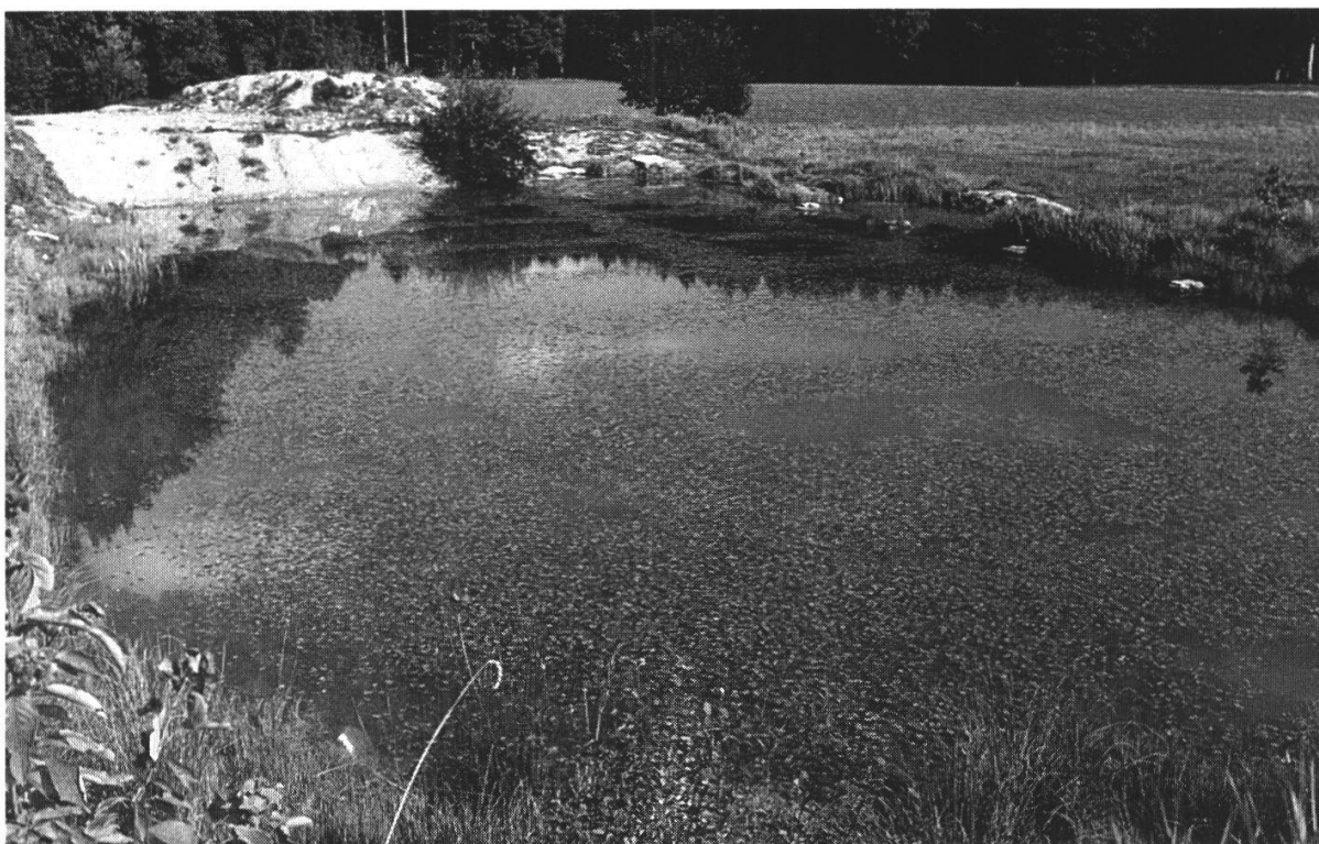
Abbildung 6: Die ehemalige Baugrube im Rüfenachtmoos wurde von einer reichen Pflanzen- und Tierwelt besiedelt. Blick von Süden. (Foto D. Forter, Oktober 1984)