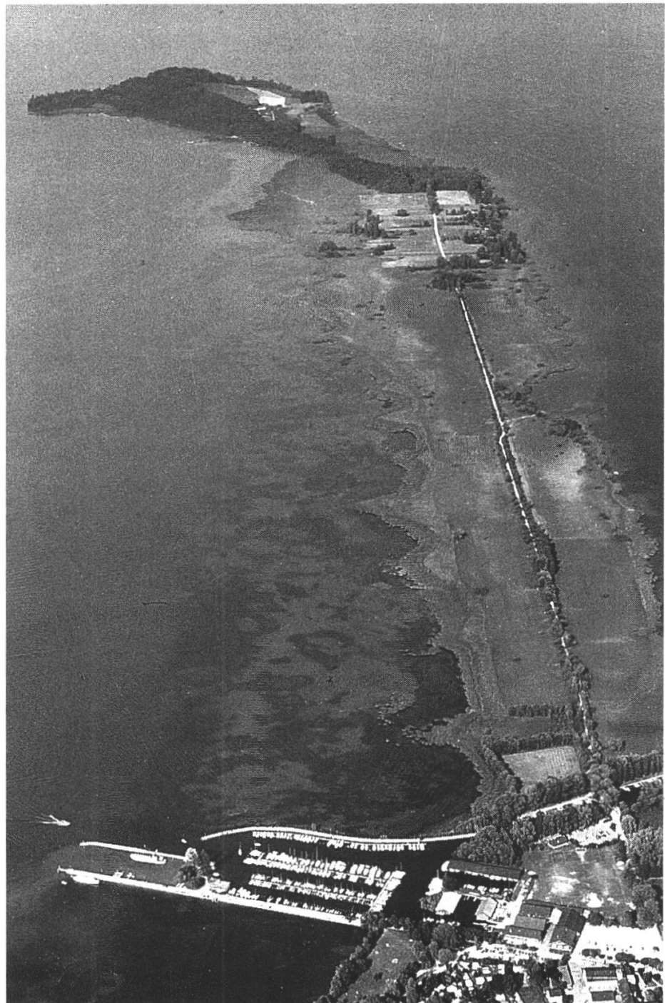
Abbildung 8: Heidenweg und St. Petersinsel. Blick von Erlach zur St. Petersinsel, etwa nach ENE. Deutlich erkennt man die Verbuschung längs des Weges und die sich auflösenden Schilfbestände. (Foto D. Forter und H. Flury, 17. August 1987)

Fläche: 257 ha, davon 77 ha Wasser, 87 ha Flachmoor, 47 ha Wald, 37 ha Kulturland und 9 ha Bauzone/Erholungsfläche