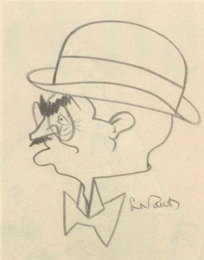
M. Politis (Griechenland)