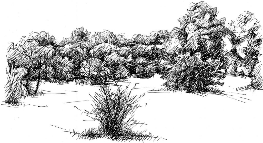
Abb. 18: Die bildhaft schöne und landschaftlich hoch charakteristische Durchdringung von Trockenrasen und Trockenbusch entspricht einem kleinstandörtlichen Mosaik des kiesigsandigen Schotterbodens, auf dem sich die Reinacherheide ausdehnt. Zeichnung: F. BALDINGER.