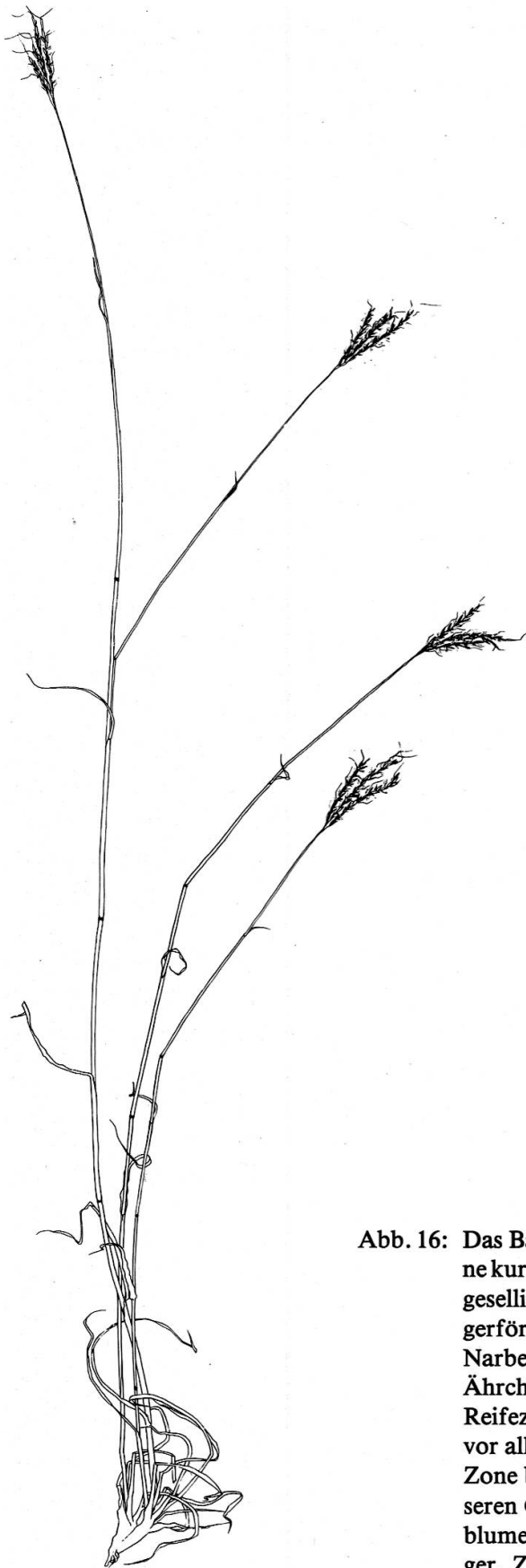
Abb. 16: Das Bartgras ( Andropogon ischaemum ) besitzt eine kurz kriechende Grundachse und wächst deshalb gesellig. Wegen seiner eigenartigen Gestalt der fingerförmig gestellten Ähren und der purpurnen Narben ist es leicht kenntlich. Ährchenbasis und Ährchenglieder sind langhaarig und deshalb zur Reifezeit zum Lufttransport geeignet. Das Gras ist vor allem in den wärmeren Teilen der gemäßigten Zone beider Erdhälften weltweit verbreitet, in unseren Gegenden aber streng lokalisiert, wie Kugelblume und Feldmannstreu ein echter Trockenzeiger. Zeichnung: F. BALDINGER.