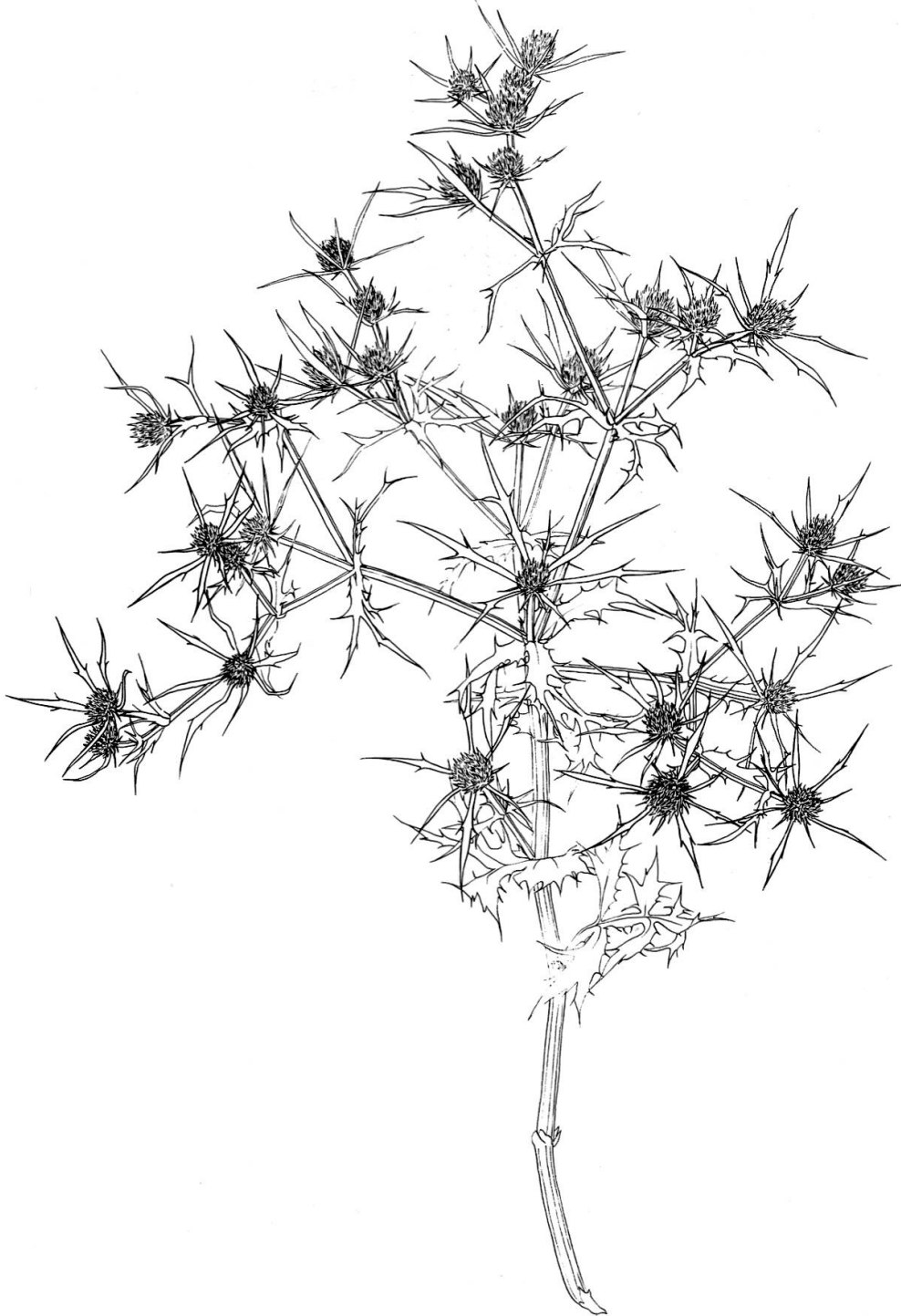
Abb. 15: Der Feld-Mannstreu ( Eryngium campestre ) ist die wohl auffälligste Kennart der Reinacherheide-Trockenrasen. Saftarm-trocken und hartlaubig, einer Distel ähnlich, gehört aber zu den Doldenblütlern, ein Spätsommerblüher und extremer Tiefwurzler. Nach der Fruchtreife löst sich die ganze Pflanze in Bodennähe und wird als kugeliges Gebilde über den steppenartigen Rasen gerollt – ein sog. Bodenläufer, eine für steppenartige Vegetation charakteristische Verbreitungsart. Zeichnung: F. BALDINGER.