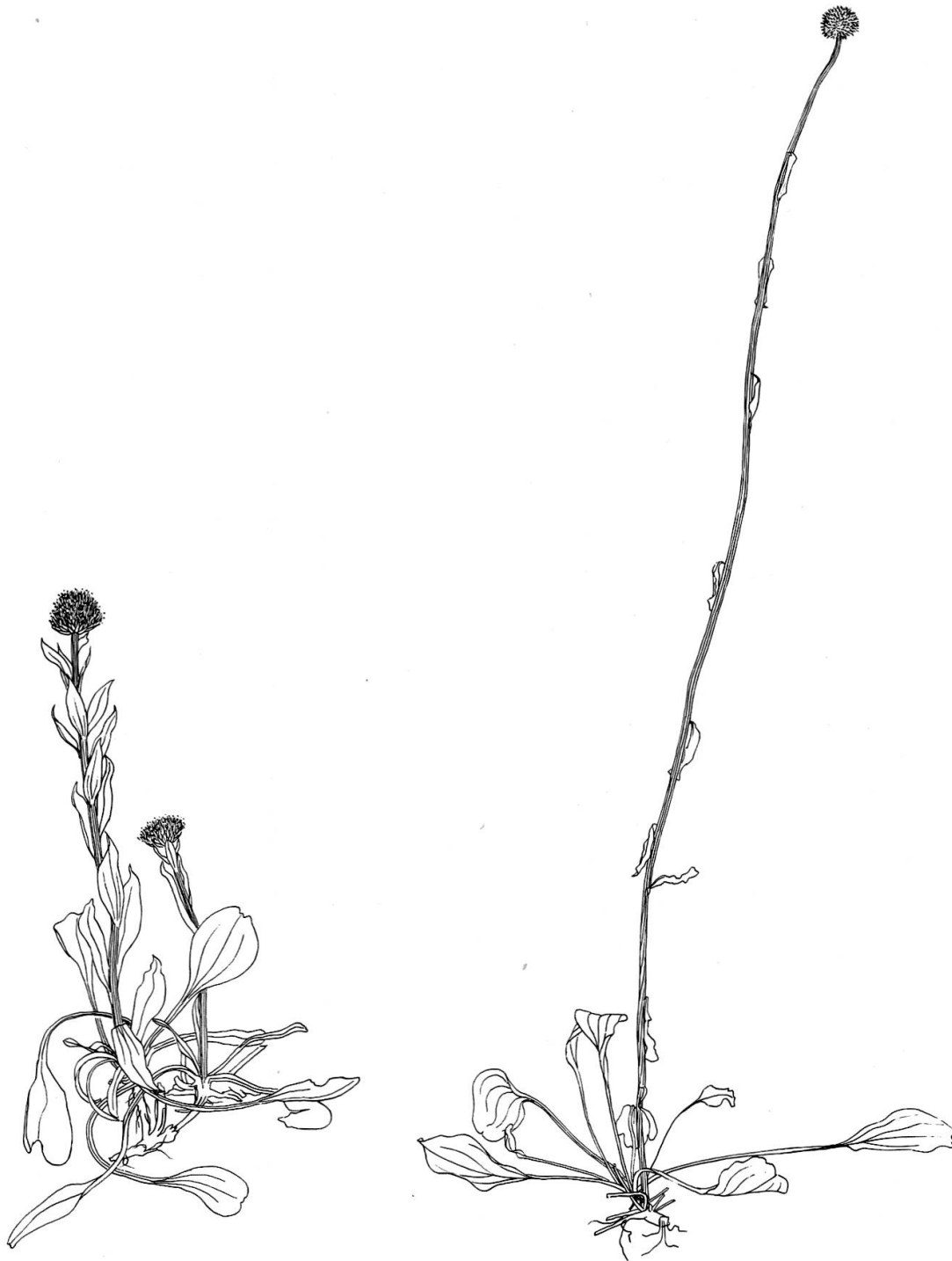
Abb. 17: Die Kugelblume ( Globularia elongata ) ist ein echter Trockenzeiger und eine gute Kennart der Trockenrasen. Dafür spricht u.a. die lederige Struktur der Blätter. Eine blüten- und verbreitungsbiologische Eigenart der Pflanze ist im Bild festgehalten, nämlich die postflorale Verlängerung des Stengels. Links ist ein blühendes und ein eben verblühtes, bereits in der Streckphase begriffenes Köpfchen dargestellt. Die Abbildung rechts zeigt Köpfchen und Stengel, lang ausgewachsen, im Fruchtzustand. Auf diese Weise wird der Blütenstand auf kurzem Stengel dem blütenbesuchenden Insekt bodennah dargeboten, die pelzigen Früchte dagegen auf gewaltig verlängertem Stengel dem Winde entgegengestreckt. Zeichnung: F. BALDINGER.