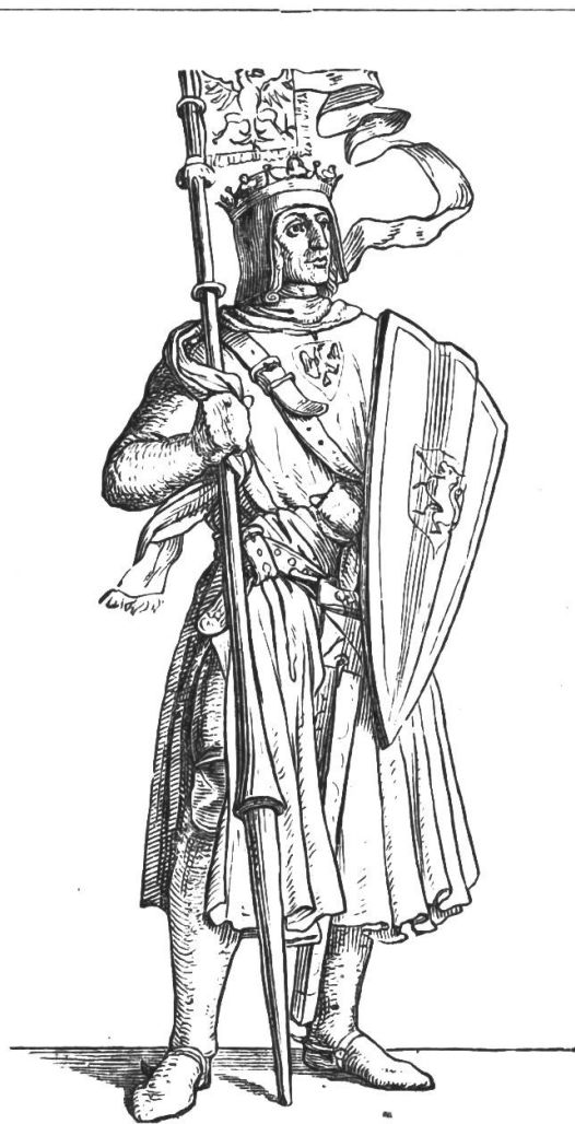
König Rudolph von Habsburg.

vorgedrückt war. 'S war so rechtes Sudelwetter, empfindlich kalt und der Himmel zeigte mehr Lust zum Schneien als zum Regnen. Eines Morgens war König Rudolph, seiner Gewohnheit gemäß, ziemlich früh aufgestanden. Er froh nicht wenig, denn das Zimmer war nicht geheizt, aus dem einfachen Grunde, weil es keinen Ofen hatte. Fröstelnd schaute er zum Fenster hinaus und bemerkte, daß seiner Herberge gegenüber ein Bäckerhaus stand, in dem schon alles vollauf beschäftigt war. Dem König kam der Gedanke sich da drüben am Kohlenfeuer zu erwärmen. Gedacht, gethan! — Um nicht erkannt zu werden, kleidete sich Rudolph in einen ganz gewöhnlichen Leibrock, wie ihn unbemittelte Dienst-