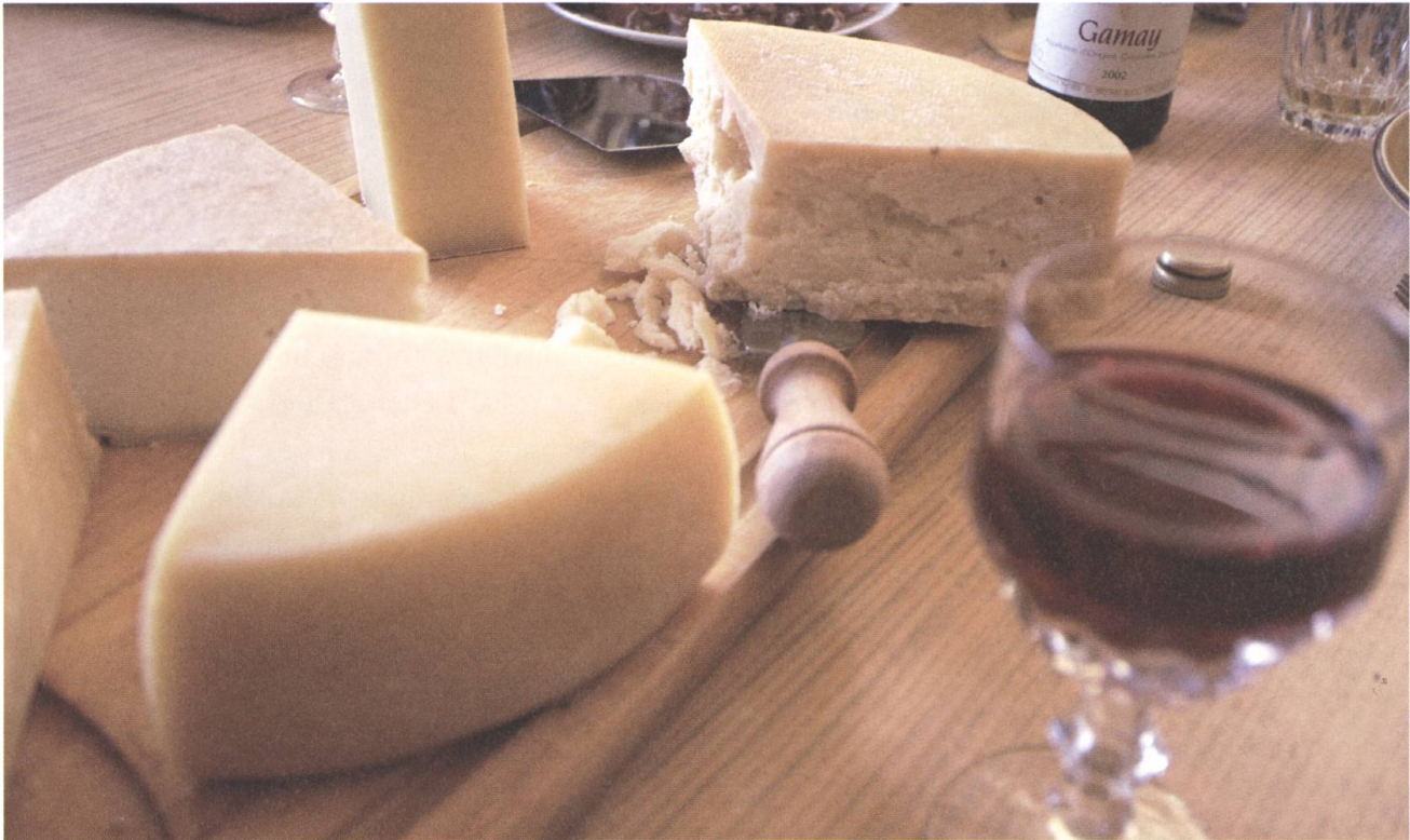
Geissmilchkäse-Spezialitäten vom Stanser Geisseheimet.

pacht einer Liegenschaft entwickelte sich der ehemalige Nebenerwerbsbetrieb zu einem Vollerwerbsbetrieb, in Nidwalden eher eine Ausnahme. Auch bei der Bauernfamilie Keiser wurden die Milchkühe durch Ostfriesische Milchschafe ersetzt. Derzeit stehen 60 Milchschafe im Stall.