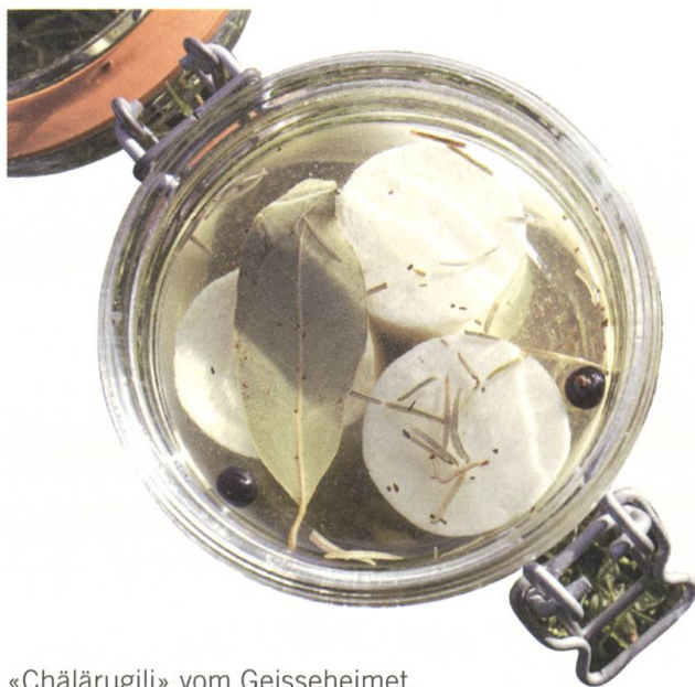
«Chälärugili» vom Geisseheimet.