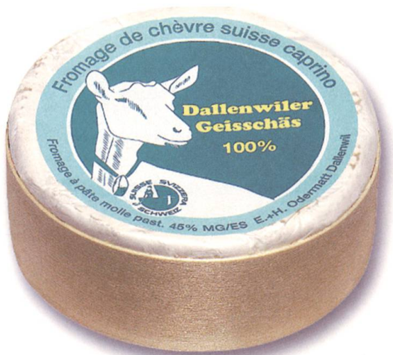
Odermatts Ziegenkäse mit Weisseschimmel.