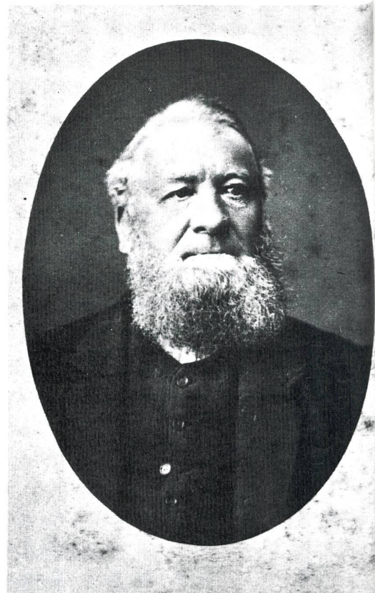
Niklaus Riggenschach (1817–1899)

Diese provisorische Lösung vermochte aber auf die Dauer nicht zu befriedigen. Rasch kam der Wunsch nach einem fest angestellten Pfarrer und einem eigenen Gotteshaus auf. Zwar bot der Oltner Gemeinderat anstelle des von der Bahn beanspruchten bisherigen Lokals die Stadtkirche an, doch erwiesen sich die in Frage kommenden Gottesdienstzeiten als ungünstig. Riggenschach gelang es noch im November, sich die finanzielle Unterstützung der schweizerischen Hilfsvereine zu sichern. Daraufhin wurde Edmund Fröhlich, ein Sohn