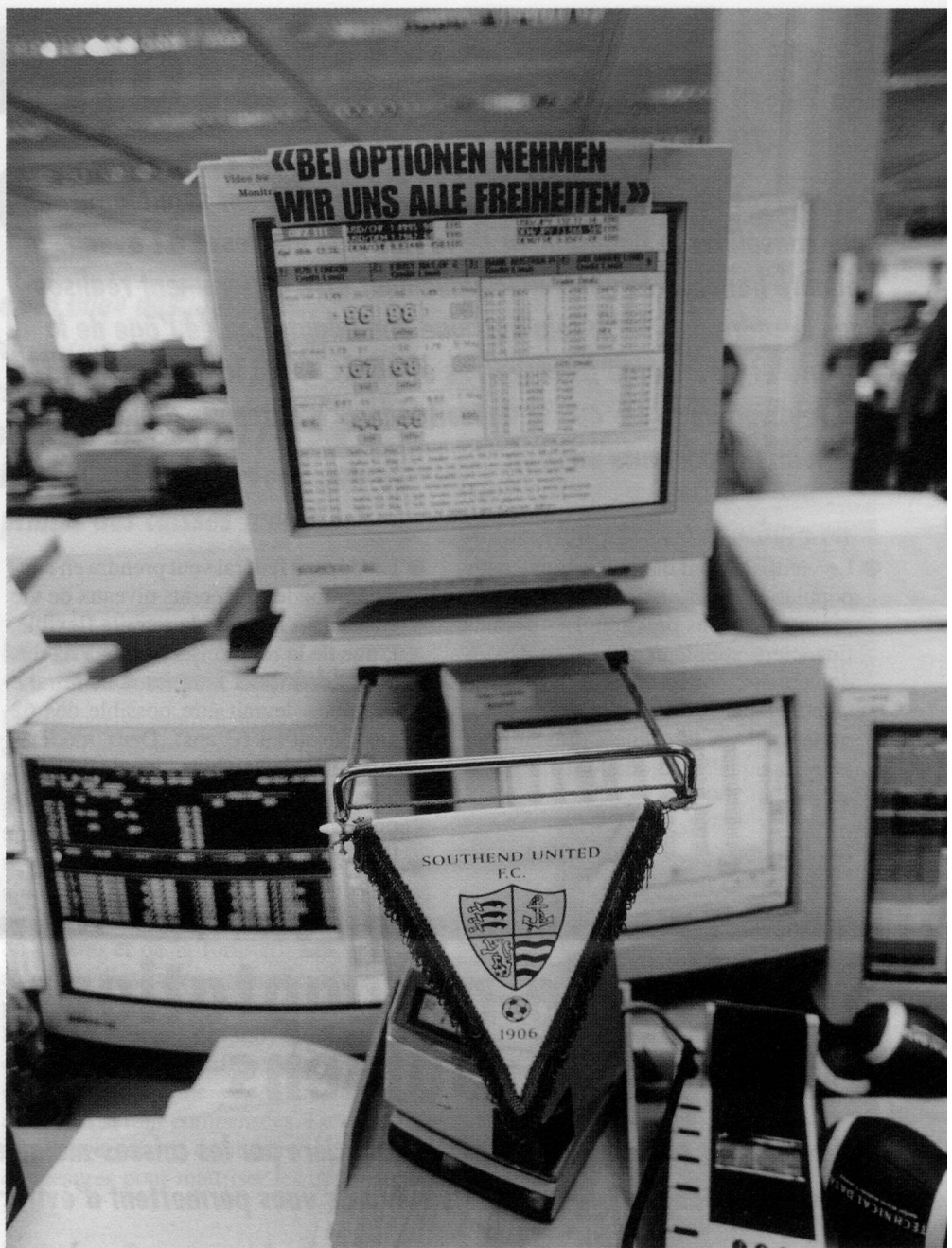
Im Backoffice: Die Freiheit beziehungsweise die Freizeit des Anlageberaters