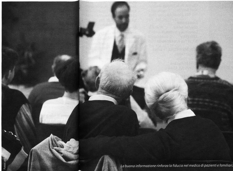
La buona informazione rinforza la fiducia nel medico di pazienti e familiari.