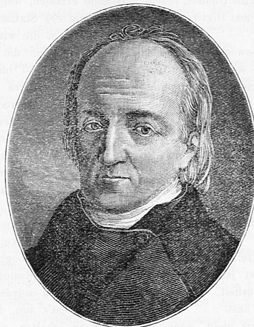
Emanuel von Fellenberg