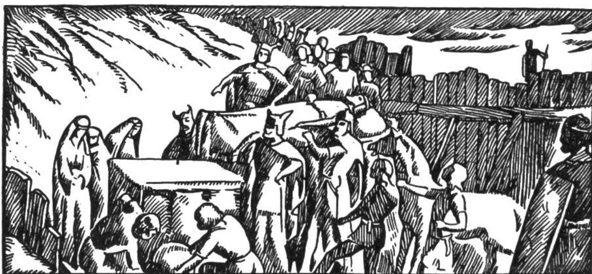
Bestattung Alarichs im Busento.