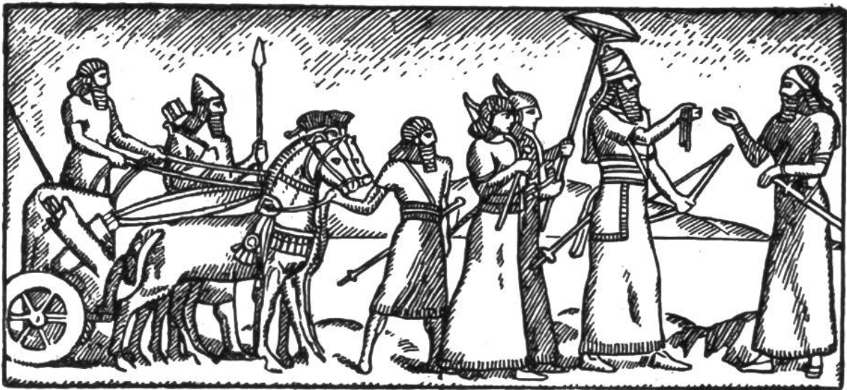
Assyrischer König mit Gefolge.