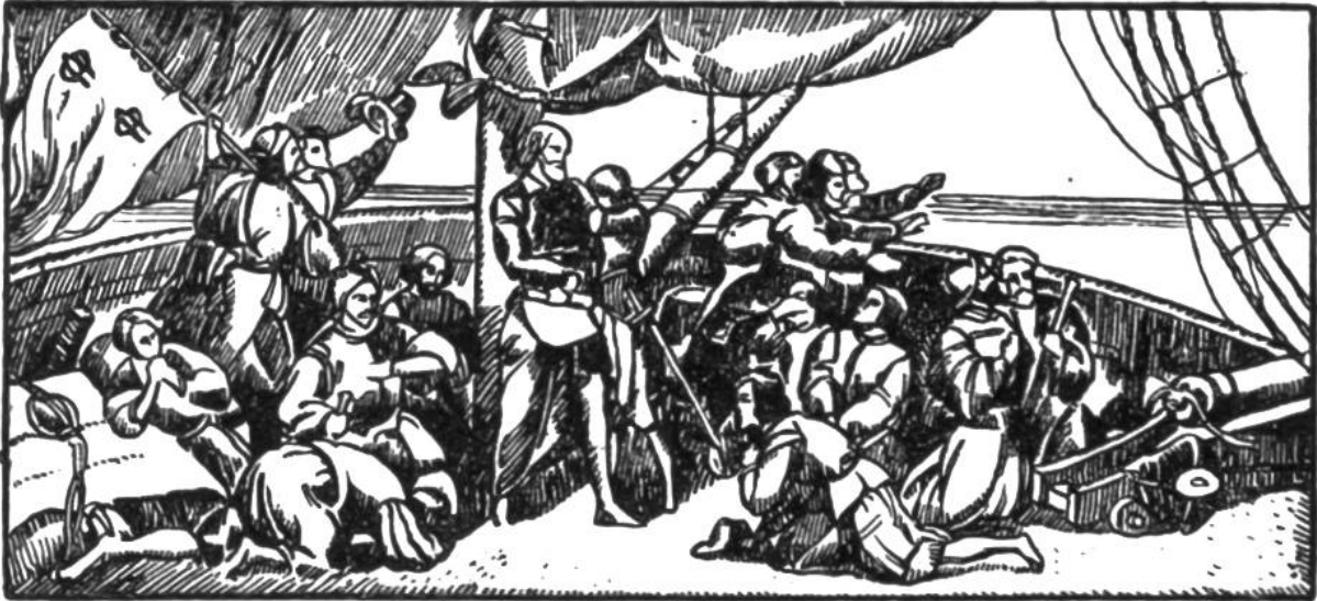
Kolumbus und seine Gefährten angesichts Land.

1481 Stanser Verkommnis, Nikolaus von der Flüe als Friedensstifter. Freiburg u. Solothurn werden in den eidgenössisch. Bund aufgenommen.