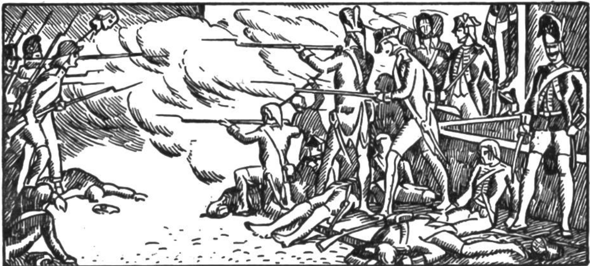
Verteidigung der Tuilerien durch die Schweizergarde.

1689—1725 Zar Peter der Große macht Rußland zu einer europäischen Großmacht. 1700—1721 Nordischer Krieg. Peter der Große von Rußland, Sachsen, Polen und Dänemark gegen Karl XII. von Schweden. 1701—1741 Span. Erbfolgekrieg. 1712 Zweiter Dillmergerkrieg, Niederlage der katholischen Orte. 1713 Friede zu Utrecht. 1714 Friede zu Rastatt. 1740 Friedrich II., d. Große, König von Preußen u. Maria Theresia, Kaiserin v. Osterreich. 1749 Henziverschwörung in Bern. 1756—1763 Siebenjähriger Krieg. Preußen behält Schlessien. Frankreich tritt Kanada an England ab. 1761 Gründung der Helvetischen Gesellschaft. Iselin, Balthasar, Hirzel, Zimmermann, Sallis, Haller, Gebner, Lavater, Pestalozzi, Joh. v. Müller.